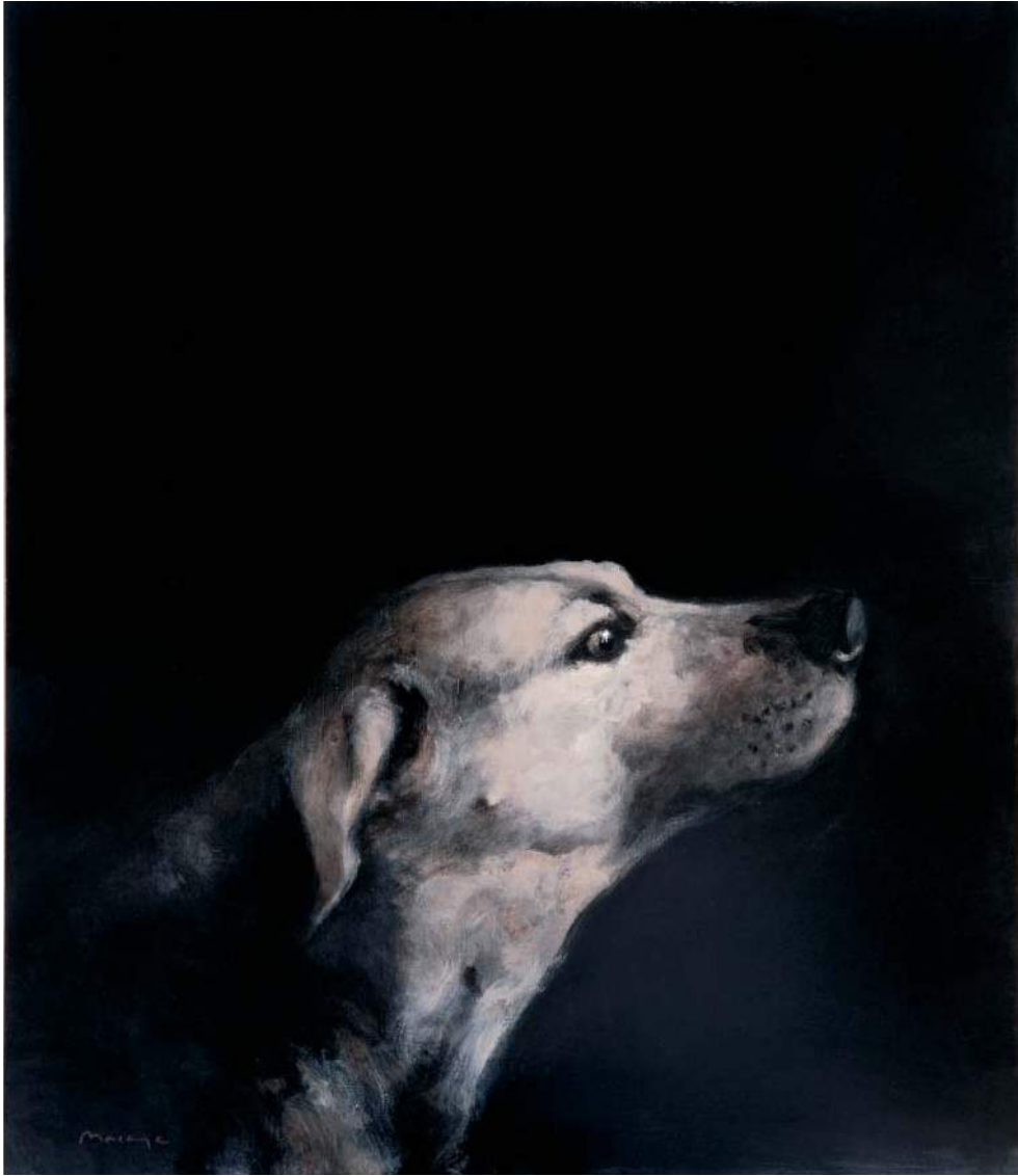
Huile sur bois - 70 x 60 cm