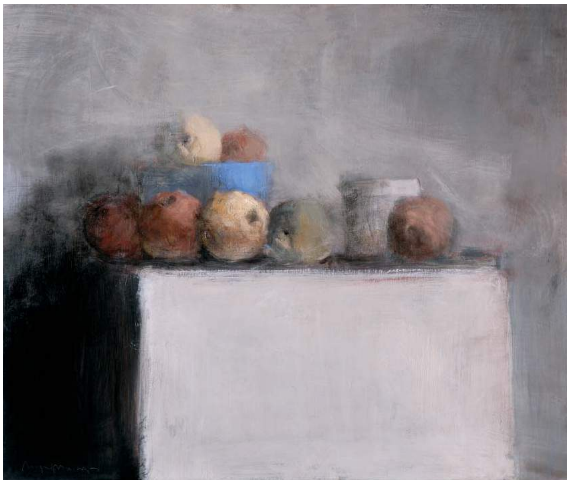
Huile sur bois - 60 x 70 cm