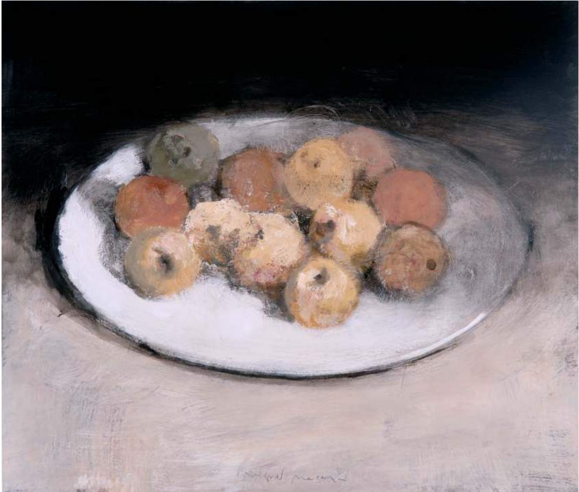
Huile sur bois - 60 x 70 cm