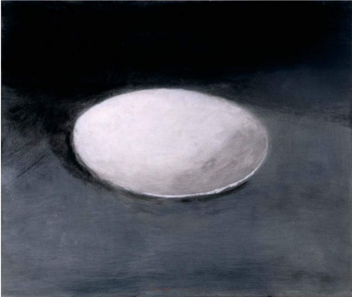
Huile sur bois - 60 x 70 cm