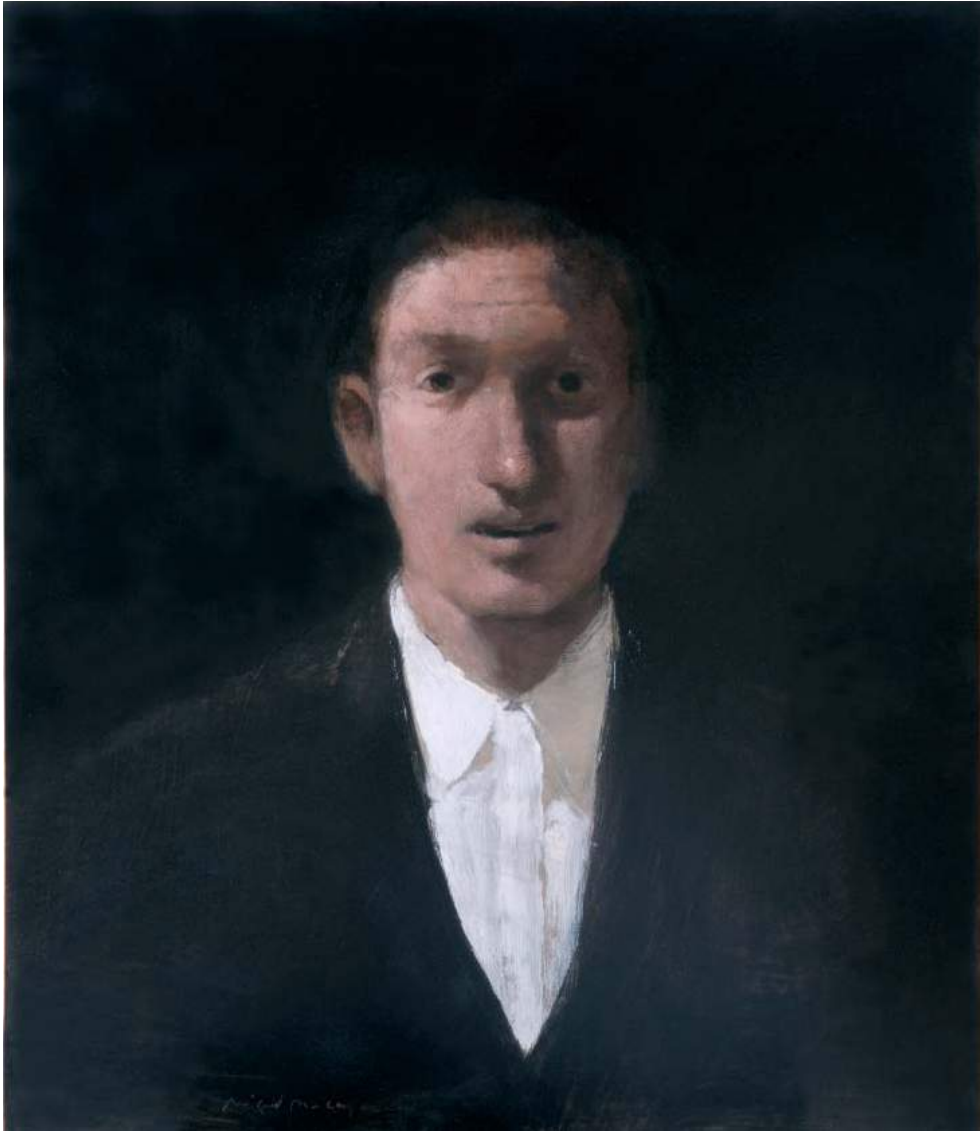
Huile sur bois - 70 x 60 cm