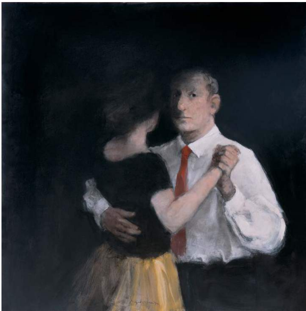
Huile sur bois - 122 x 122 cm