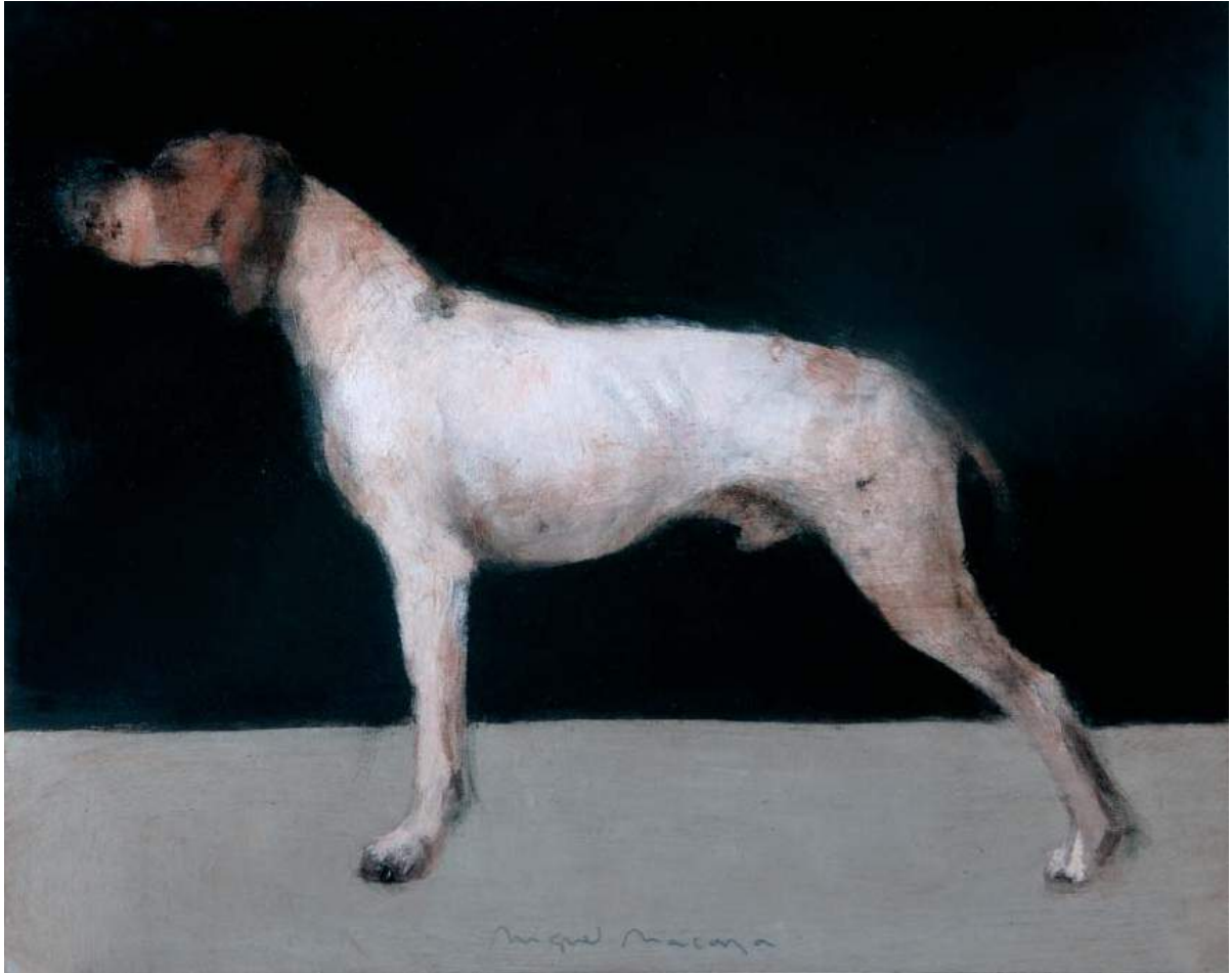
Huile sur bois - 35 x 44 cm