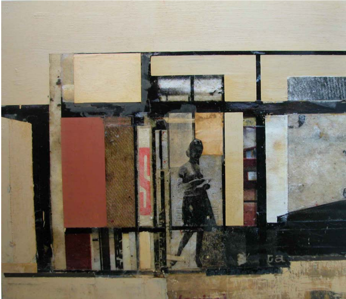
Suite, N°II/III, technique mixte sur aluminium, 146 x 125, 2005