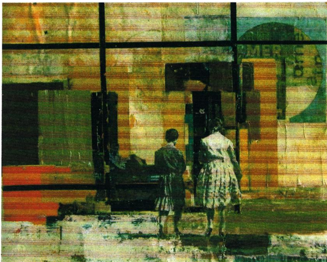
Tus ojos son ventanas

2005 - Technique mixte sur toile - 90 x 117 cm