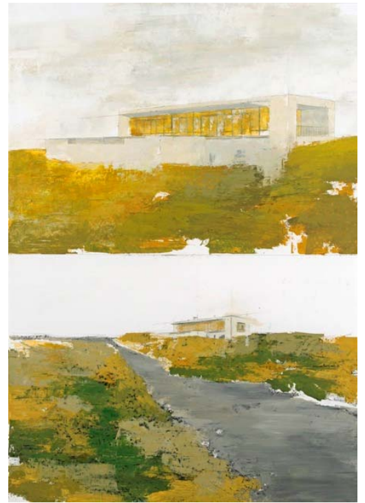
Technique mixte sur papier, 100 x 70 cm, 2011