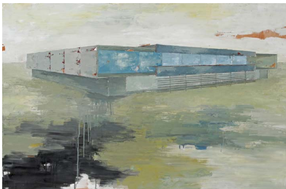
« Ventana House », huile sur bois, 95 x 116 cm, 2011

Anne de la Roussière (06 80 16 15 88) Galerie Arcturus 65, rue de Seine - 75006 Paris T : 01 43 25 39 02 – F : 01 43 25 33 89 arcturus@art11.com www.art11.com/arcturus