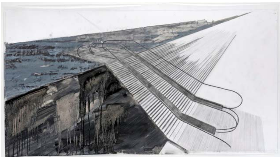
« Rolltreppe VIII », technique mixte sur calque, 35 x 44 cm, 2012