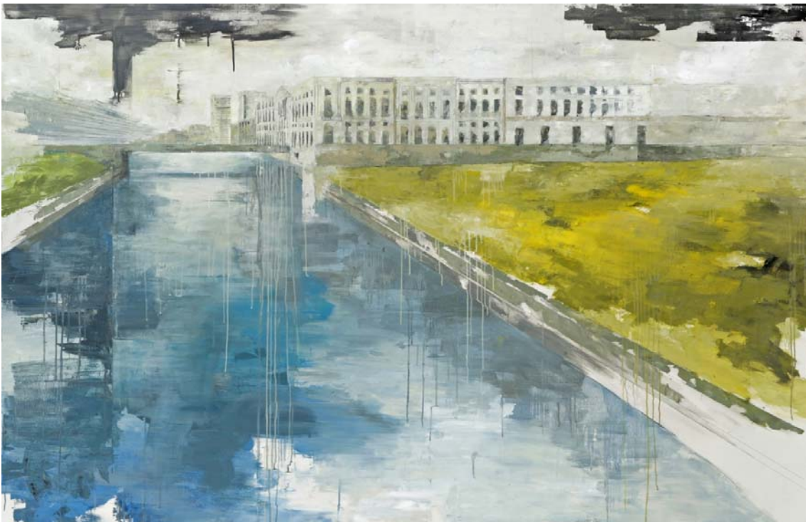
« An der spree », huile sur lin, 130 x 200 cm, 2012