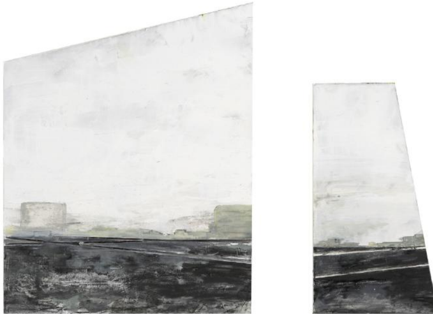
« Entail I », dyptique, huile sur bois, 43 x 50 cm, 2012

Ma recherche picturale prend pour prétexte des no man's land urbains, des périphériques abandonnés, des zones de non-droit, des lieux « peu fréquentés » traversés sans attention, pour traduire un monde - le nôtre - que l'on vit, subi à chaque instant. C'est comme un apprivoisement, une tentative de compréhension en profondeur du présent.