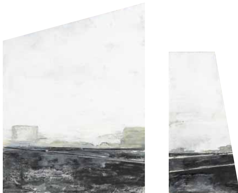
« Entail I », dyptique, huile sur bois, 43 x 50 cm, 2012