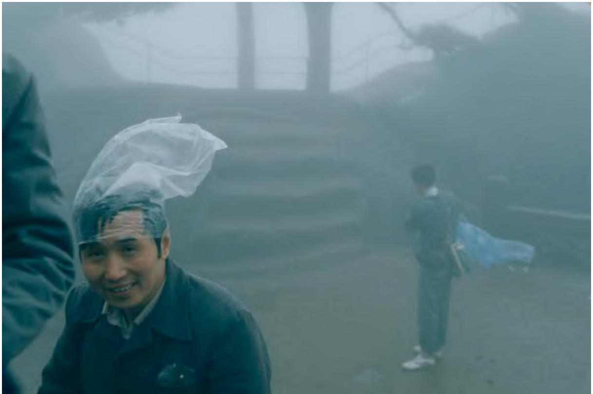
Sur la terrasse de Jade, Huang Shan – La Montagne des Peintres Chinois, 1985 Photographie argentique, 40 x 50 cm