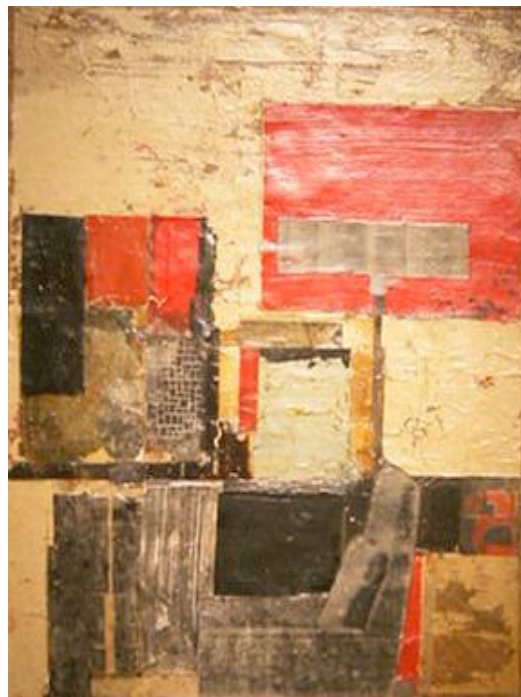
Suite, 2005 Technique mixte sur toile, 55 x 46