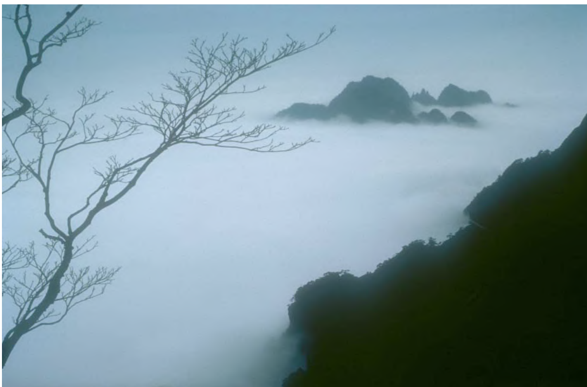
Mer de Nuages de l'Ouest - Huang Shan, La Montagne des Peintres Chinois, 1985 Photographie argentique, 40 x 50 cm

François Cheng – Extrait de la préface du livre « Huang Shan, Les Montagnes Célestes » (Flammarion)