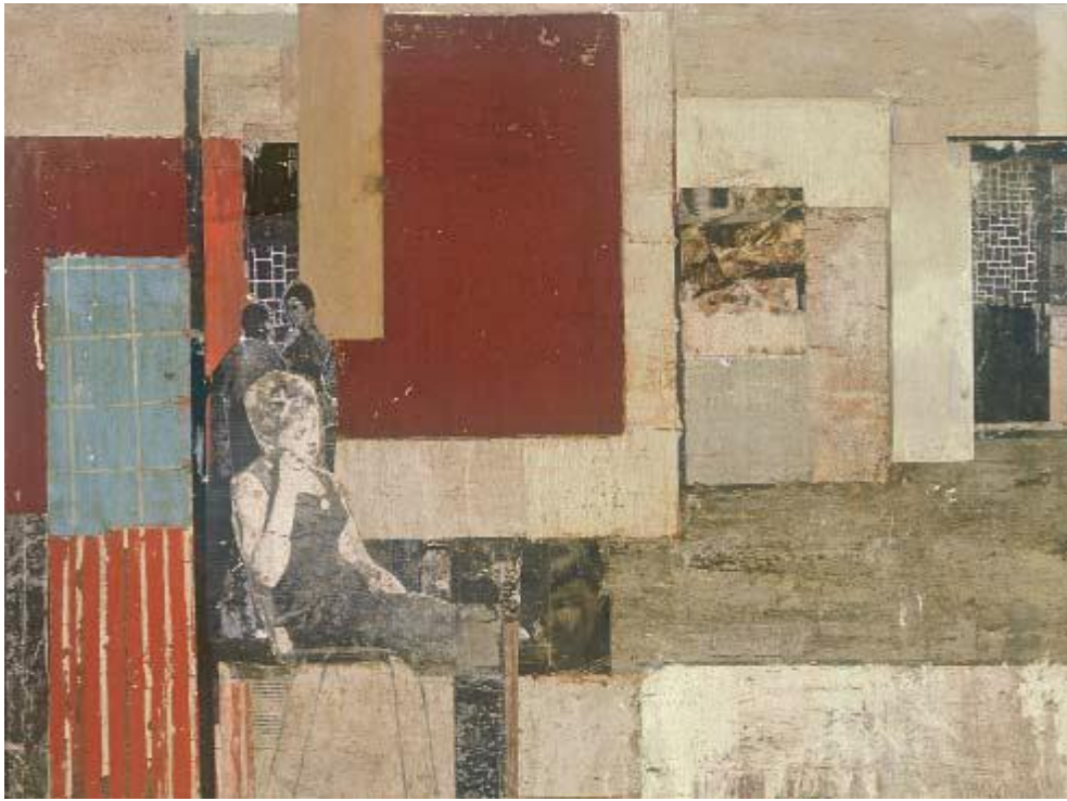
Sans Titre, 2005 Technique mixte sur toile, 97 x 130