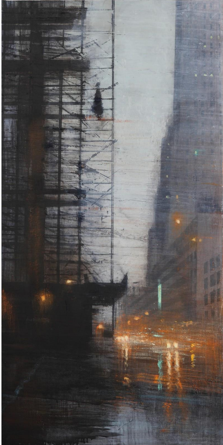
Huile sur bois - 120 x 60 cm