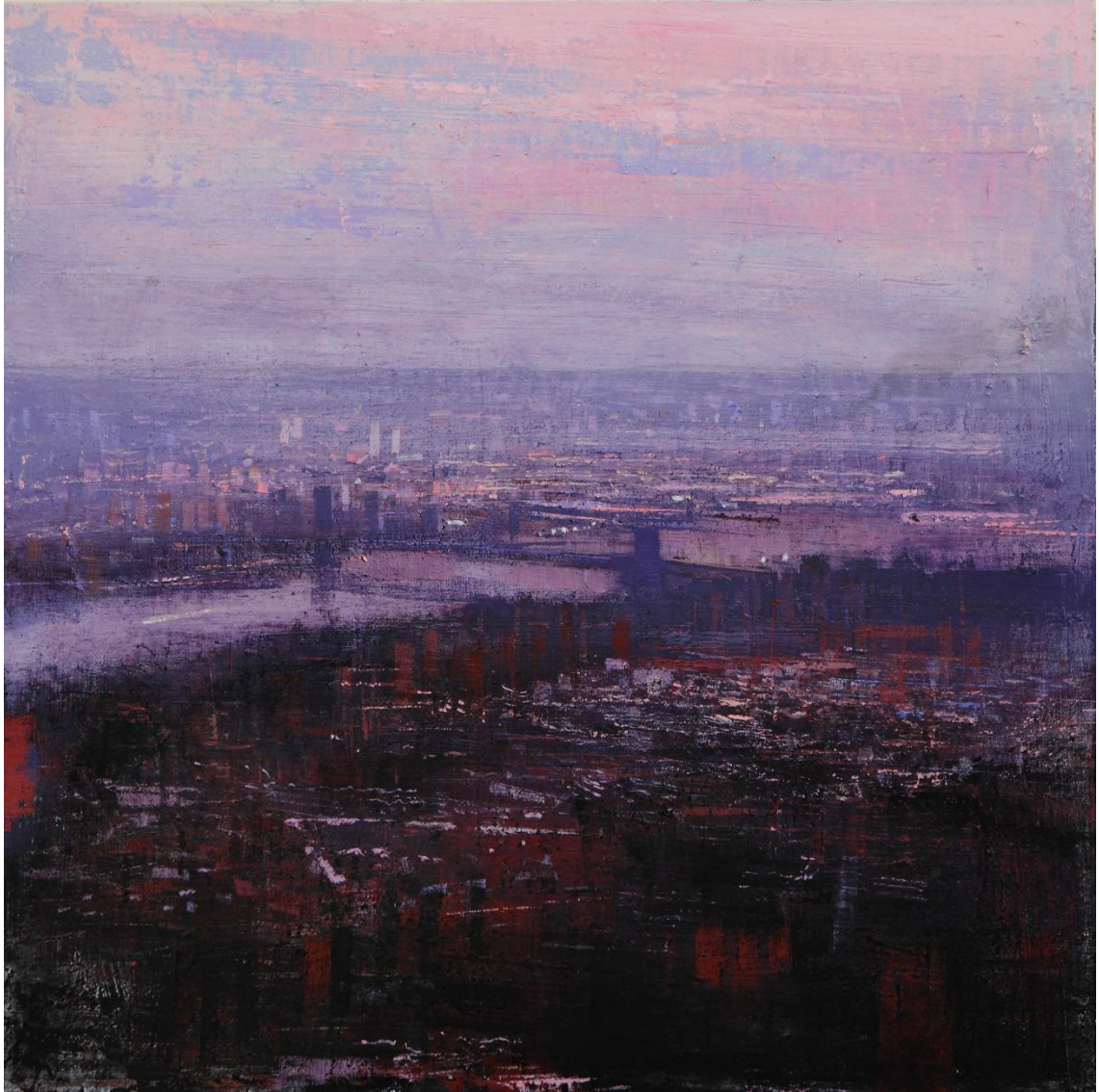
Huile sur bois – 85 x 85 cm