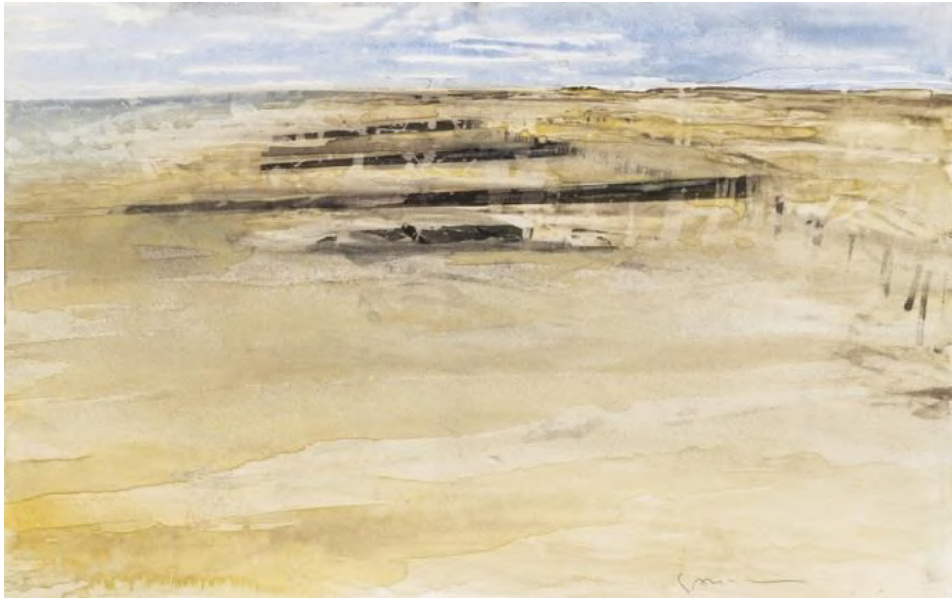
« Brise lame », Watercolor on paper, 32,5 x 50 cm, 1990