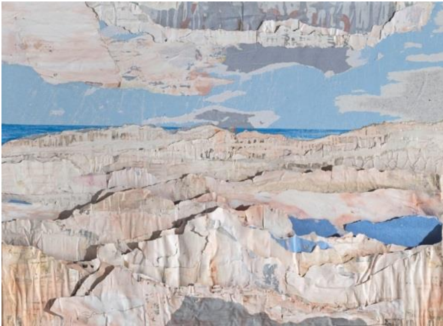
« Très très vague » - Collage, acrylique, ink, paper mache, on canvas 51 x 69 cm - 2018