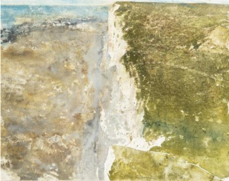
« Sotteville », Watercolor in paper, 47 x 60 cm, 1995