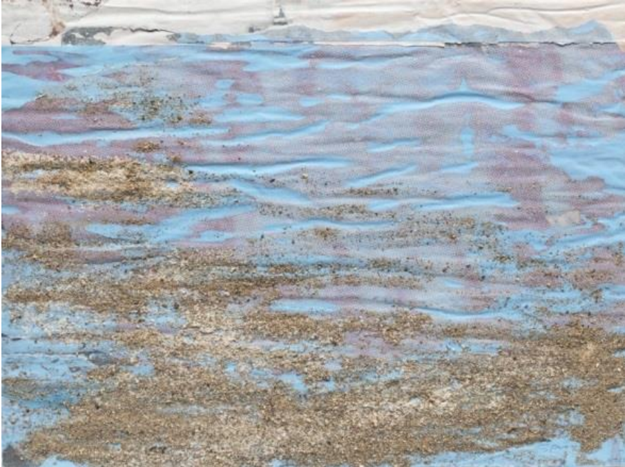
« Le sable des vagues » - Collage, watercolor, sand, on cardboard 30 x 40 cm - 2019