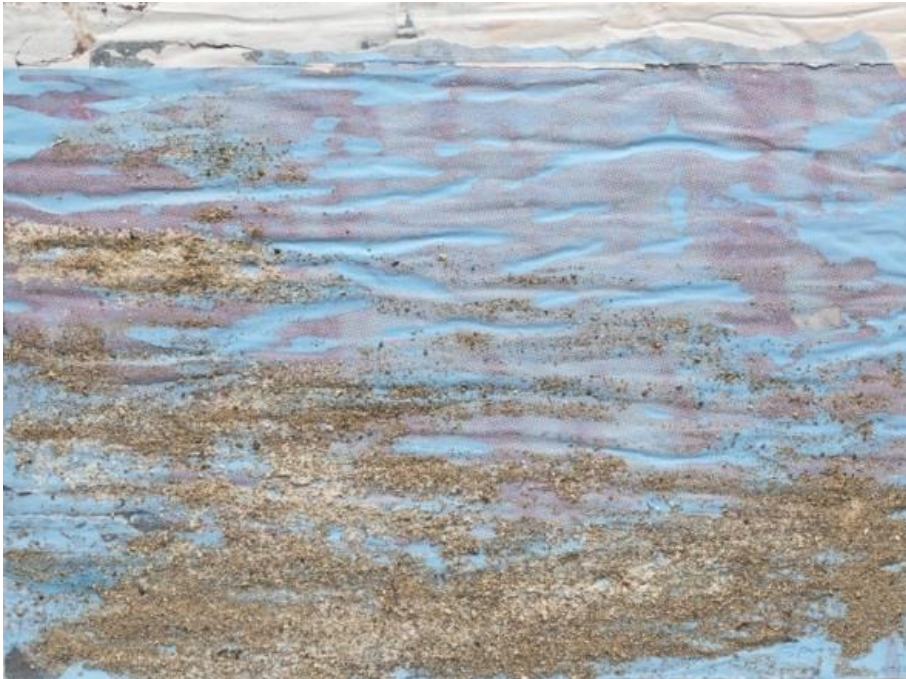
« Le sable des vagues » - Collage, watercolor, sand, on cardboard 30 x 40 cm - 2019