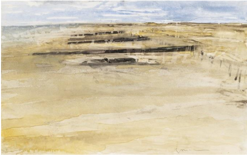
« Brise lame », Watercolor on paper, 32,5 x 50 cm,1990