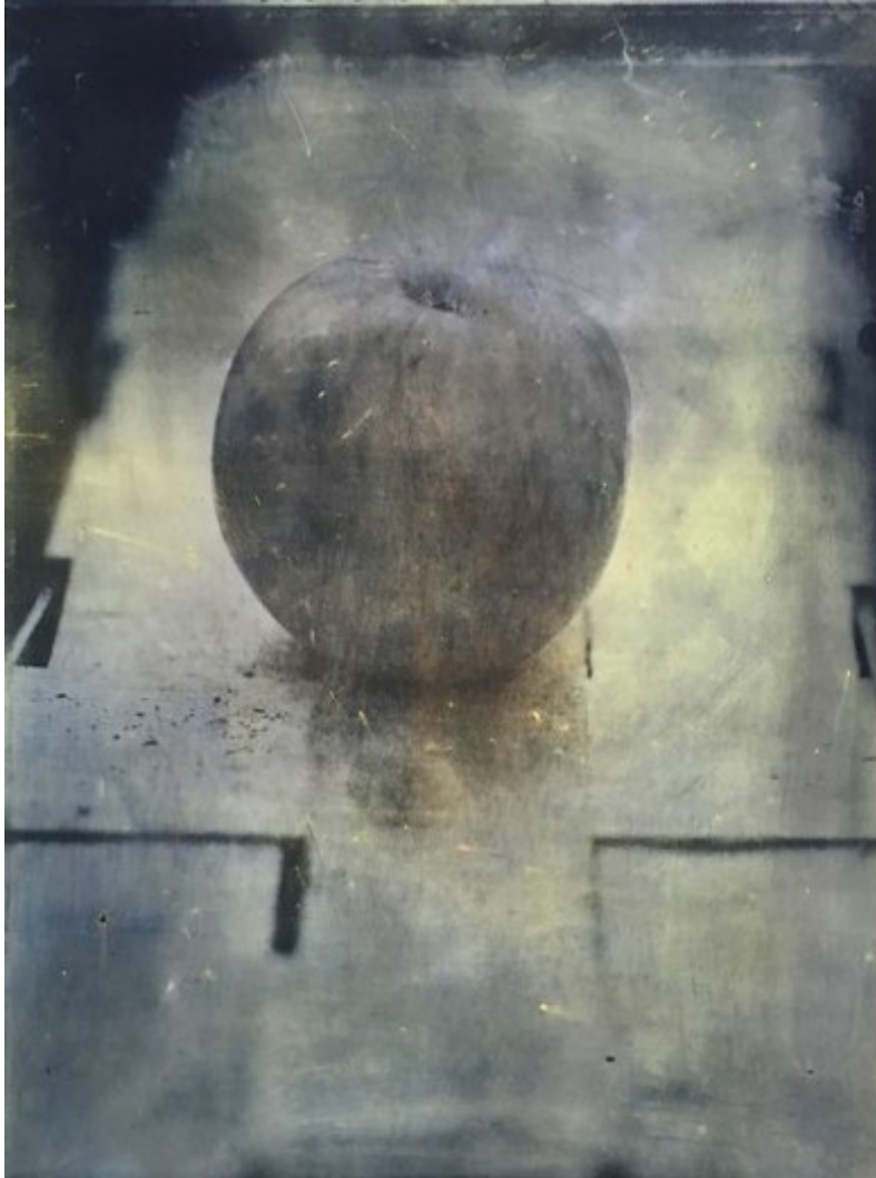
Mela gris, 100 x 80 cm