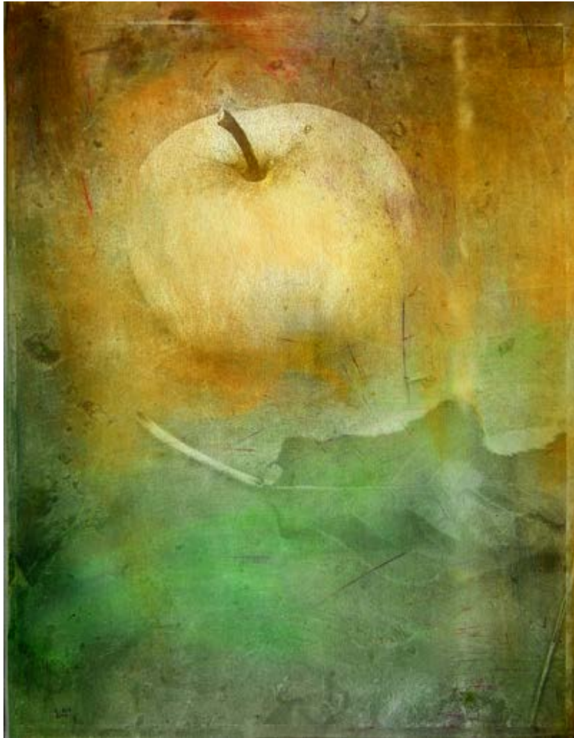
Goldene Frucht, 100 x 81 cm