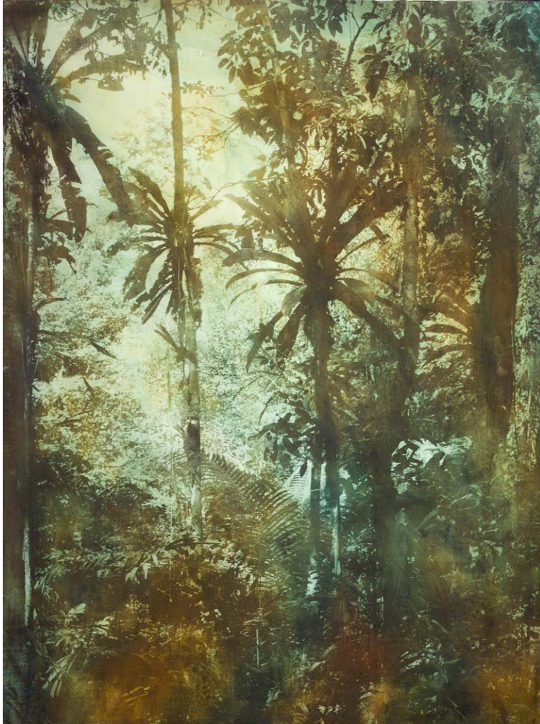
Mania Som, 150 x 120 cm