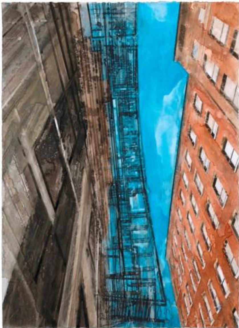
« NY escalier de secours II », aquarelle sur papier, 73,5 x 53,5 cm