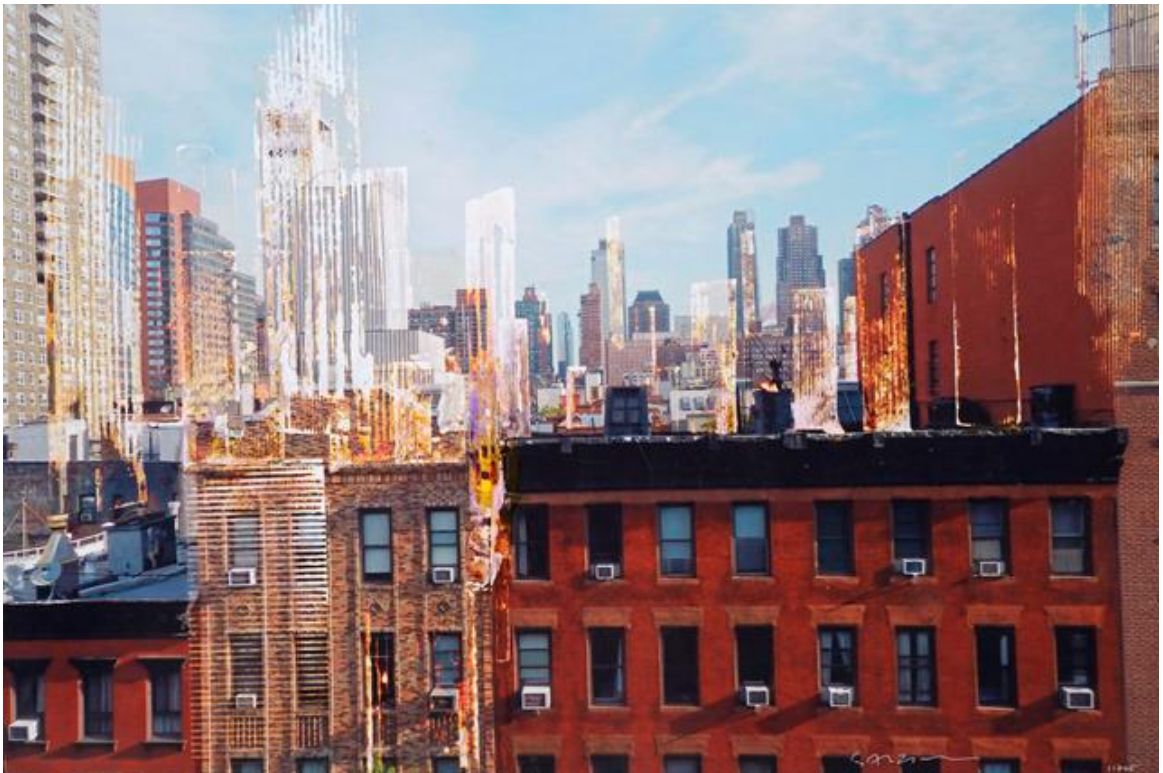
« Clinton district », Aquarelle sur papier, 50 x 75 cm