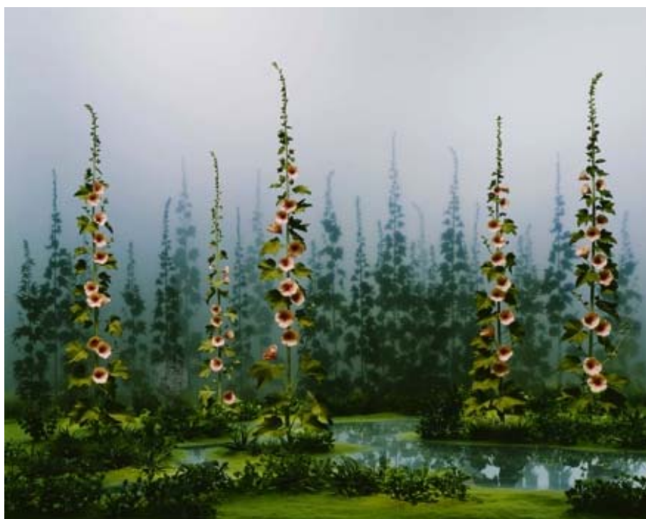
« Le jardin », Tirage C- Print, 30 ex