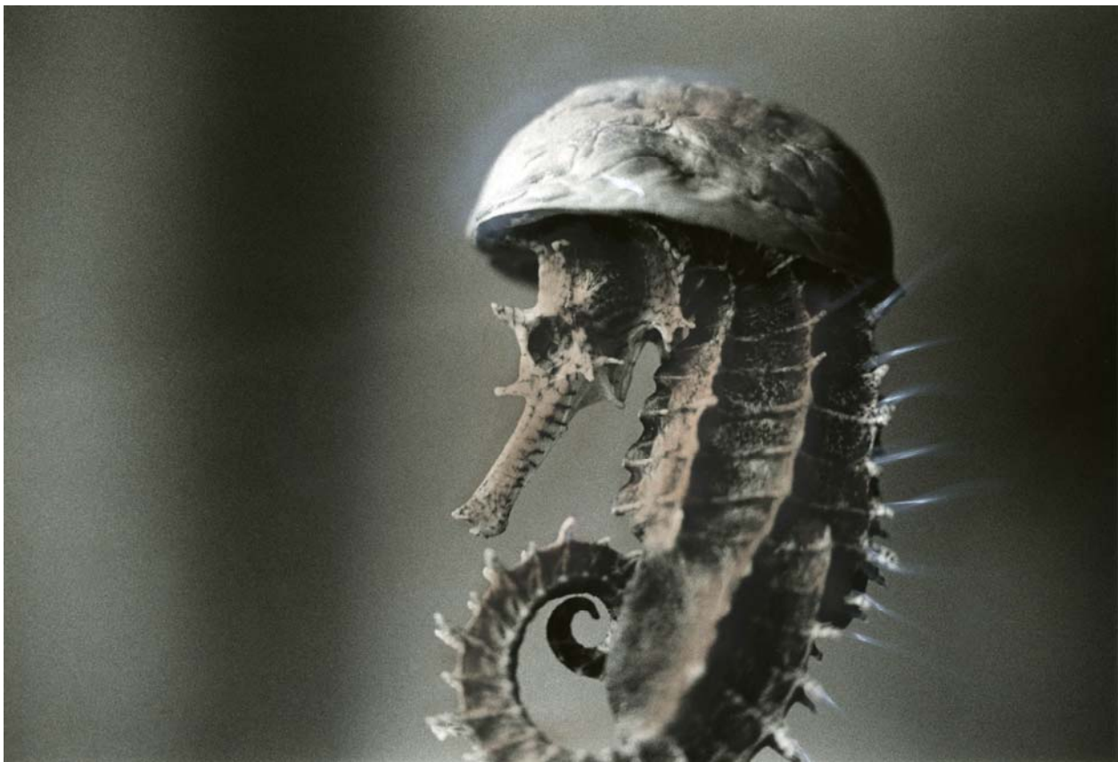
« Helmut », tirage argentique noir et blanc et rehaut pastel, 15 ex