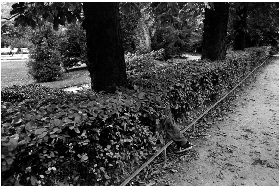
« Jardin du Luxembourg, Paris », Tirage argentique noir et blanc, 21 ex