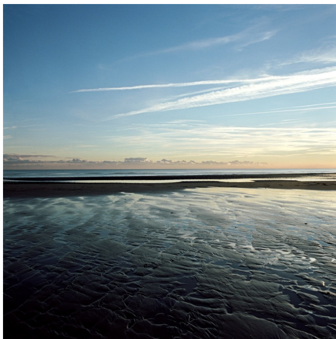
Tim HALL, Camber sands III, impression pigmentaire sur papier aquarelle