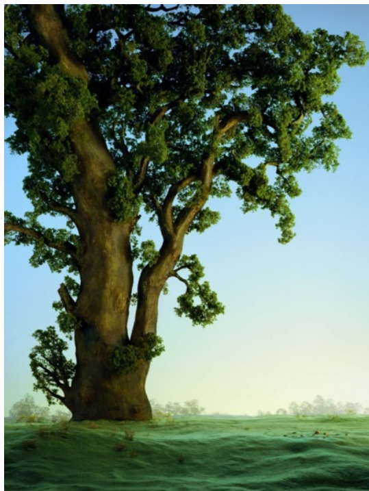
Didier MASSARD, Arbre en été, C-print