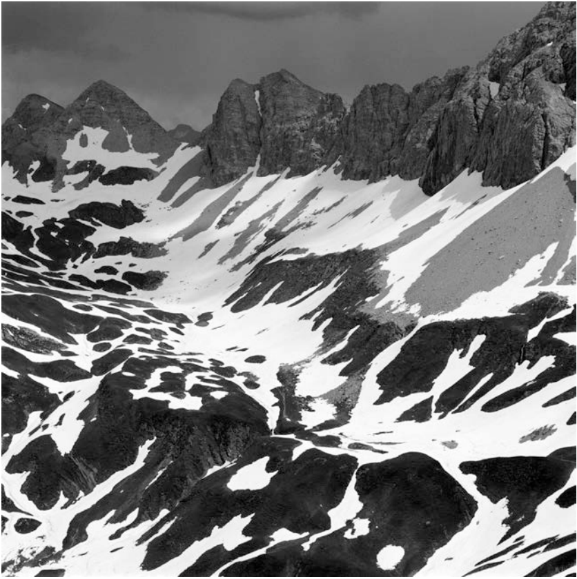
Tim HALL, Cow Hide, Impression pigmentaire sur papier aquarelle