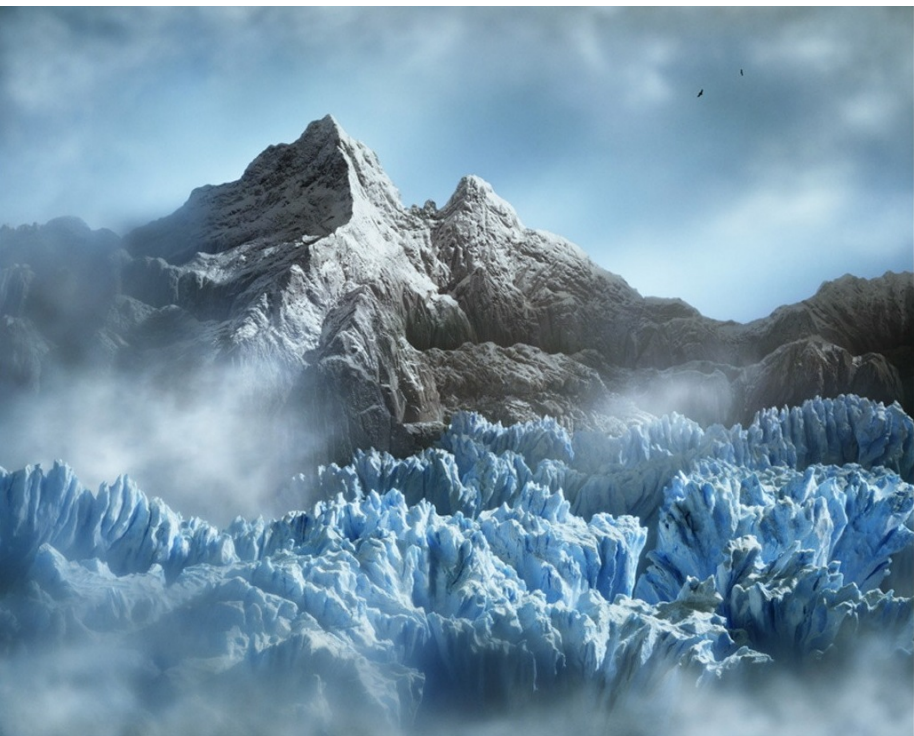
Didier MASSARD, Le Glacier, C-print