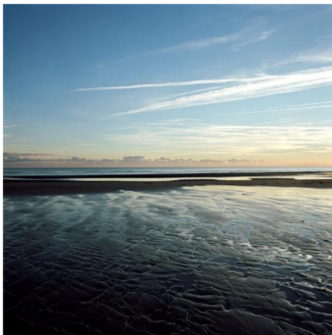
Tim HALL, Camber sands III, impression pigmentaire sur papier aquarelle