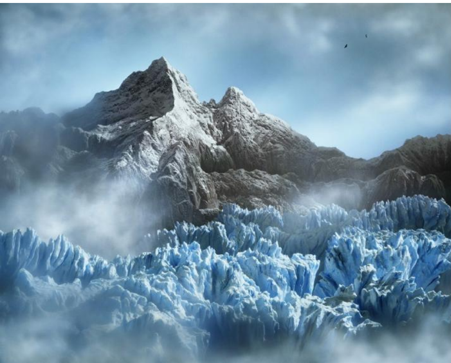
Didier MASSARD, Le Glacier, C-print