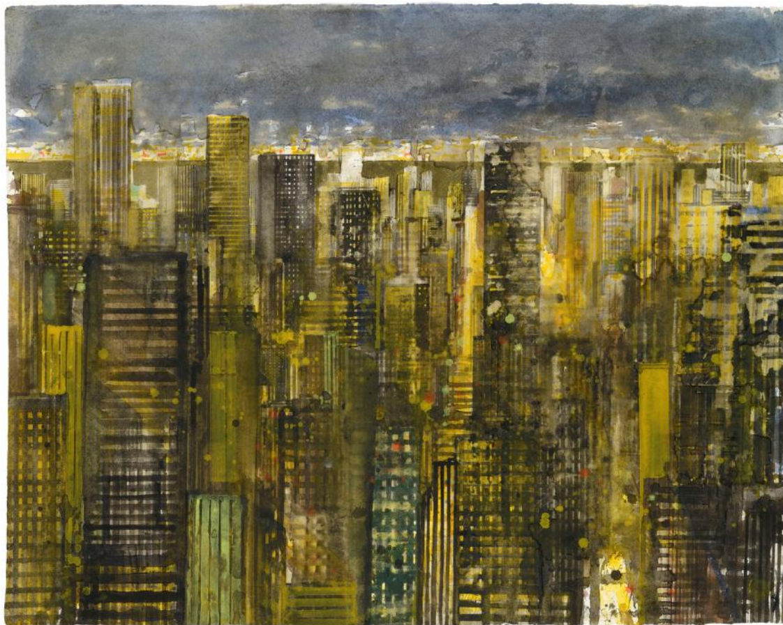
« NY at night », Aquarelle sur papier, 49,5 x 62 cm