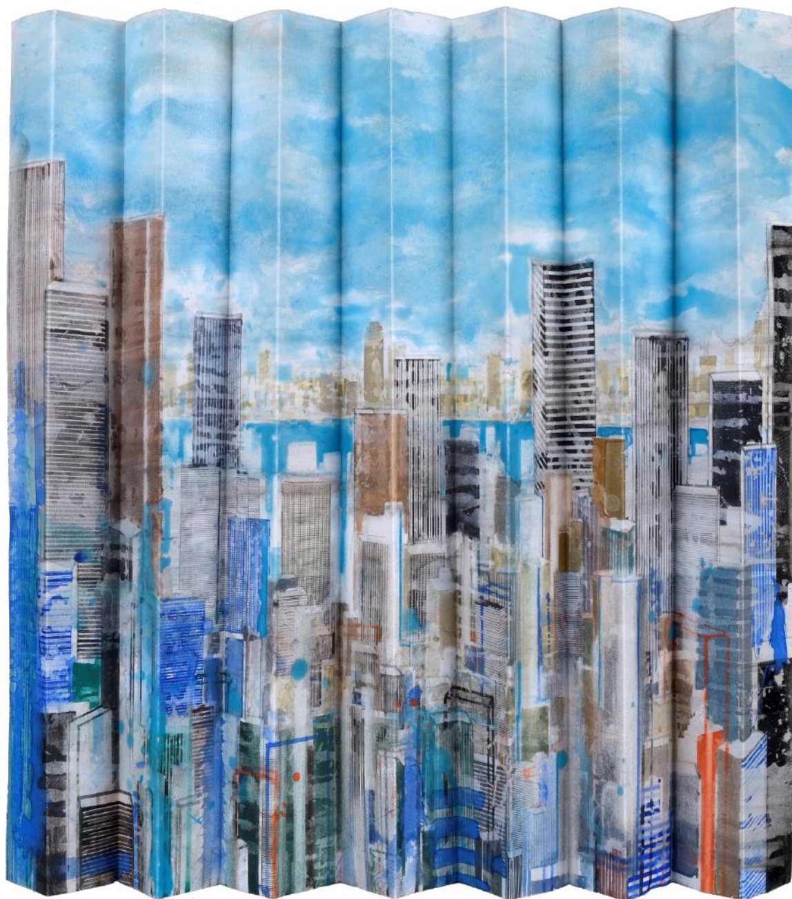
NY Folded II, Aquarelle sur papier 75, 8 x 110 cm