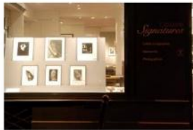
1. Musée de l'Homme, Paris, octobre 2014, novembre, 12 novembre 2015 2. Galerie Espace 54, Paris, 12 novembre 2015 3. Galerie Espace 54, Paris, 12 novembre 2015 4. Photo Saint-Germain 2015, Paris, 12 novembre 2015