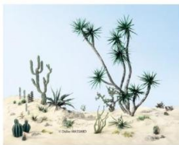
Didier MASSARD, "Les cactus", C-Print.

Lundi 23 Novembre 2015 10:53:18 par Antoine Coutin dans Festivals