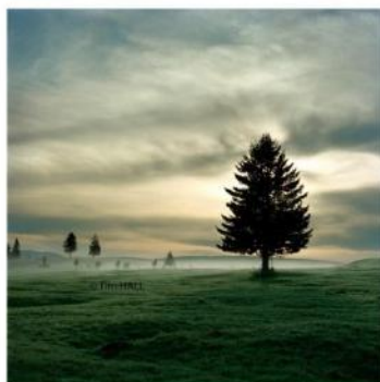
Tim HALL, "Tree in the mist", Impression pigmentaire sur papier aquarelle.

La photographie de paysages fait partie des thèmes classiques de la créativité en images. Les paysages n'ont pas seulement enthousiasmés les grands peintres, mais aussi les plus grands photographes. Avec les paysages fabriqués de toutes pièces par Didier MASSARD, et ceux captés sur les routes du monde de Tim HALL, cette exposition met face à face un photographe Français et un photographe Anglais. Chacun a choisi un chemin opposé pour assouvir une même soif d'infini, d'ailleurs, un même désir de capturer un instant magique, de partager ses émotions face à la majesté de la montagne, la magie de la lumière sur la mer, ou la noblesse d'un arbre solitaire.