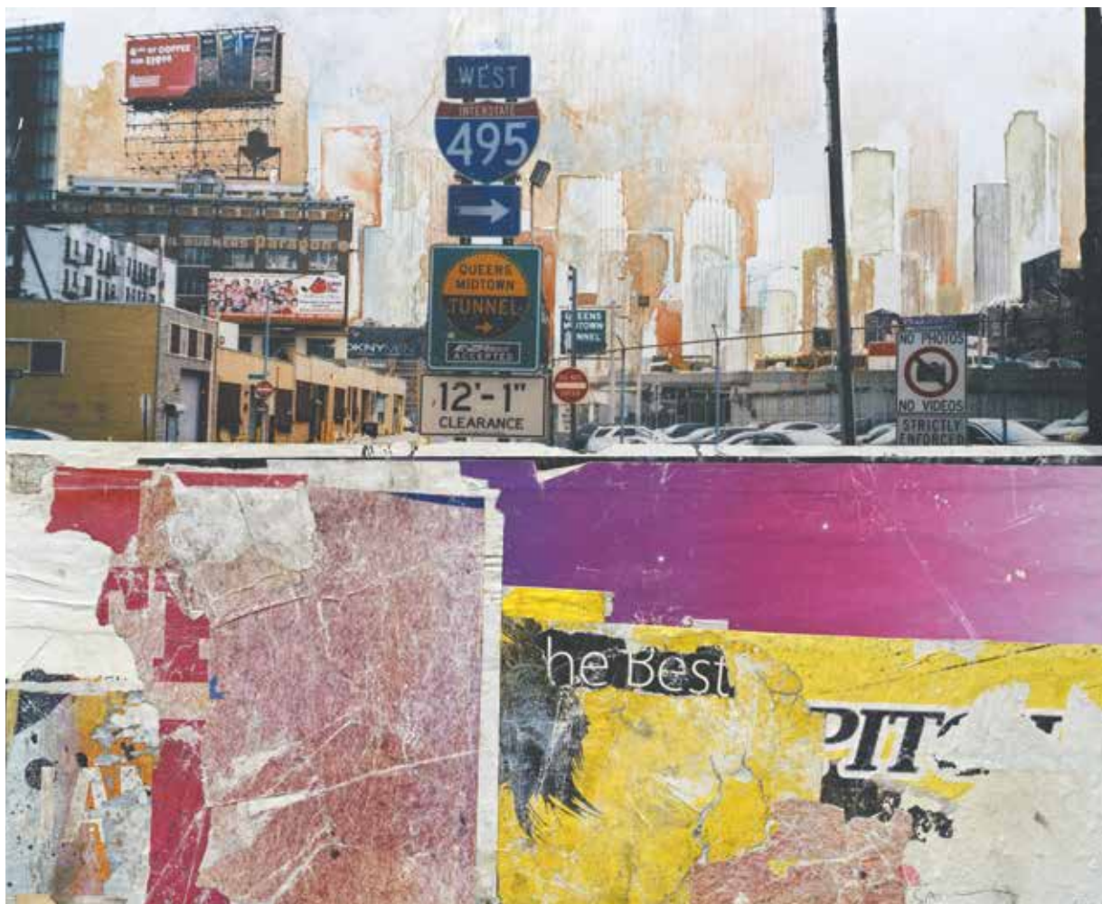
« No photos no videos » - Technique mixte (photo, collages) marouflé sur bois - 60 x 73 cm