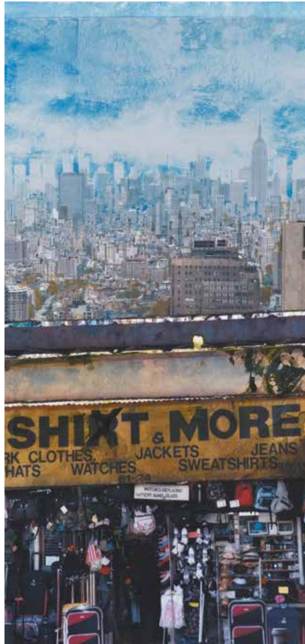
« Shit and more » - Technique mixte (photo, collages) marouflé sur toile -109 x 55 cm