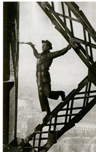
Marc Riboud, Le Peintre de la tour Eiffel , 1953, tirage argentique.

« ACTE I – LES PEINTRES », galerie Arcturus, 65, rue de Seine, 75006 Paris, 01 43 25 39 02, du 11 septembre au 4 octobre. + d'infos : http://bit.ly/7301arcturus Et « ACTE II – LES PHOTOGRAPHES ET LES SCULPTEURS », du 8 au 31 octobre. + d'infos : http://bit.ly/7301sculpteurs