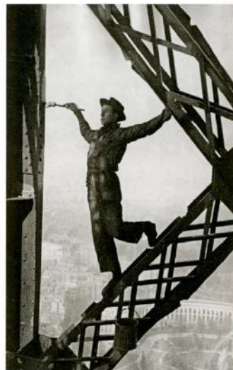
Marc Riboud, Le Peintre de la tour Eiffel , 1953, tirage argentique.

« ACTE I – LES PEINTRES », galerie Arcturus, 65, rue de Seine, 75006 Paris, 01 43 25 39 02, du 11 septembre au 4 octobre. + d'infos : http://bit.ly/7301arcturus Et « ACTE II – LES PHOTOGRAPHES ET LES SCULPTEURS », du 8 au 31 octobre. + d'infos : http://bit.ly/7301sculpteurs