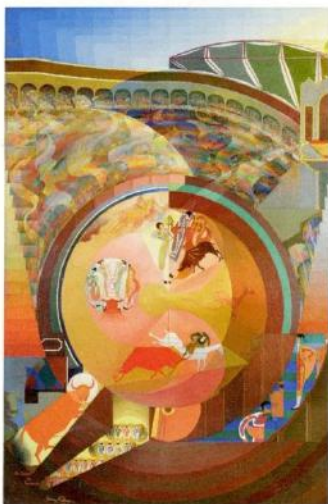
Henry Valensi, Une course de taureaux, 1926, huile sur toile, 200 x 134 cm.

Véritable découverte, cette double exposition parisienne retrace l'œuvre d'Henry Valensi, artiste futuriste dans les années 1910, fondateur du musicalisme. On y savoure un univers psychédélique avant la lettre, hybridation entre les gouaches de Klee, l'abstraction pure de Sonia Delaunay, et la ferveur des Kandinsky de la première heure. Coloriste raffiné, constructiviste et narratif, il conte avec poésie