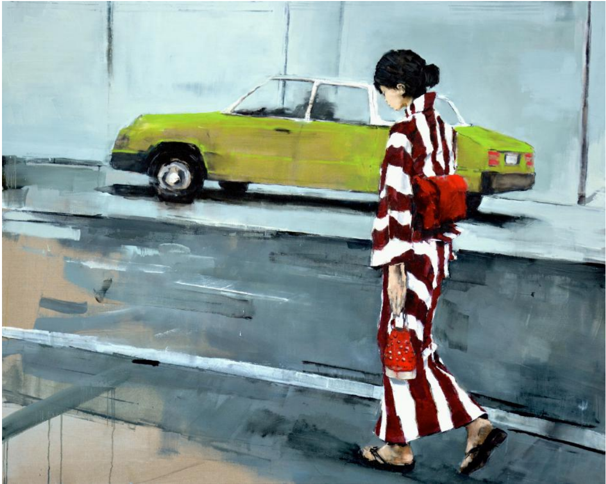
Gabriel Schmitz « Green cab » (Kyoto) 130x162cm, 2013

« Pourquoi peindre en ces temps? Pourquoi peindre, à tout moment? Pour moi, c'est une question simple, le besoin de peindre est la conséquence de l'acte simple de voir, de percevoir des images. Ce n'est pas leur qualité formelle qui appelle mon attention mais leur profondeur émotionnelle potentielle. Comme un signe d'une histoire. Peu importe l'histoire, plus elle est imprécise mieux c'est. Je me l'approprie, en quelque sorte, ou pour être plus précis, je me laisse attirer par cette possibilité, mais elle reste inexprimée. Je ne l'analyse pas, et je ne cherche pas un moyen de l'"utiliser", je contemple juste, sans raisonner, du moins pas à un niveau conscient.