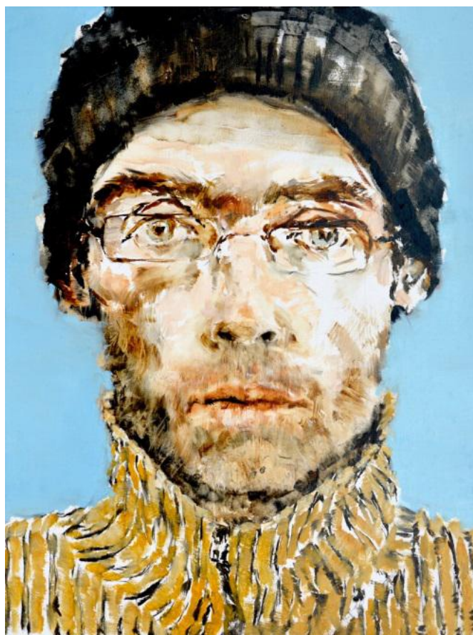
Gabriel Schmitz « Un jour froid au travail », 61x46cm, 2013