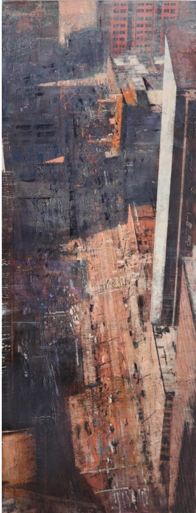
©Alejandro Quinquoces, Perspectiva de una calle con luces y sombras , Huile sur bois, 170 x 165 cm