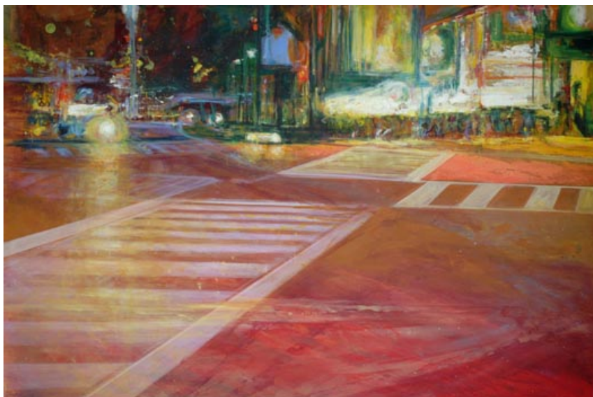
Ana Gonzalez Sola, nuit zébrée, 30 x 40 cm