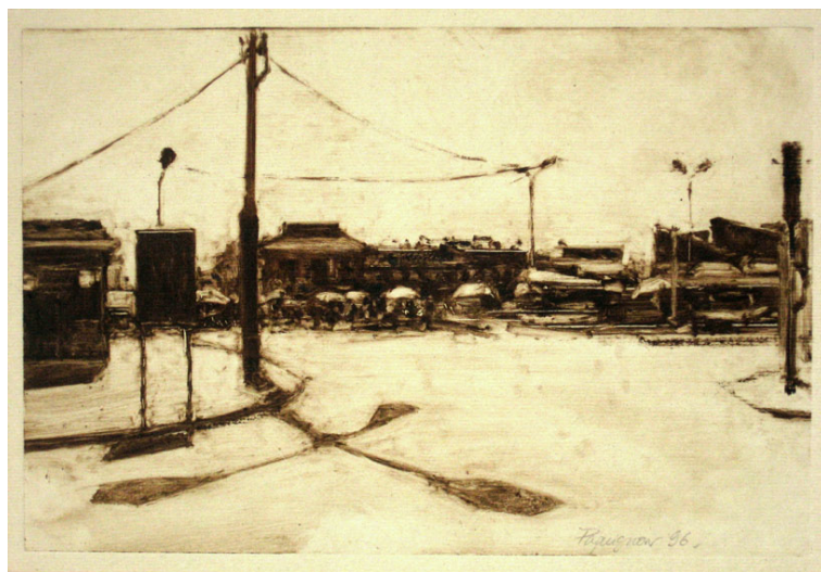
Didier Paquignon, Korcë, 23 x 32 cm

« .....L'impression est que le peintre cherche à saisir une apparence sans que cela ait un caractère illustratif. Une apparence et non un paraître, c'est-à-dire que tous ses soins sont toujours dans l'intention de suggérer, d'évoquer, au sens le plus fort de ces mots quand ils se réfèrent à l'idée d'une révélation. Réceptif aux stimulations les plus diverses. Didier Paquignon ne manque jamais d'apprécier les correspondances qu'il peut trouver entre les différents sujets qu'il traite. Non dans leur caractère narratif, mais dans la façon dont la peinture peut les rassembler. Il y va tout autant de leur inscription dans l'espace que de l'ambiguïté de leur représentation à la limite 'une identification dans une totale imbrication du sujet et de la technique. Il y va surtout de la façon dont leur rapport à la lumière les révèle dans cet espace... » Philippe Piguet, extrait catalogue « Tu rencontreras les sirènes », Ed Liénart et Musée de l'Orangerie.