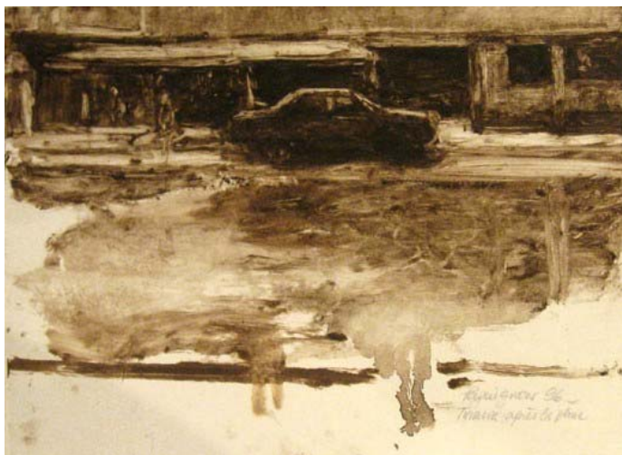
Didier Paquignon, Tirana après la pluie, 21,5 x 31,5 cm

« .....L'impression est que le peintre cherche à saisir une apparence sans que cela ait un caractère illustratif. Une apparence et non un paraître, c'est-à-dire que tous ses soins sont toujours dans l'intention de suggérer, d'évoquer, au sens le plus fort de ces mots quand ils se réfèrent à l'idée d'une révélation. Réceptif aux stimulations les plus diverses. Didier Paquignon ne manque jamais d'apprécier les correspondances qu'il peut trouver entre les différents sujets qu'il traite. Non dans leur caractère narratif, mais dans la façon dont la peinture peut les rassembler. Il y va tout autant de leur inscription dans l'espace que de l'ambiguïté de leur représentation à la limite 'une identification dans une totale imbrication du sujet et de la technique. Il y va surtout de la façon dont leur rapport à la lumière les révèle dans cet espace... » Philippe Piguet, extrait catalogue « Tu rencontreras les sirènes », Ed Liénart et Musée de l'Orangerie.