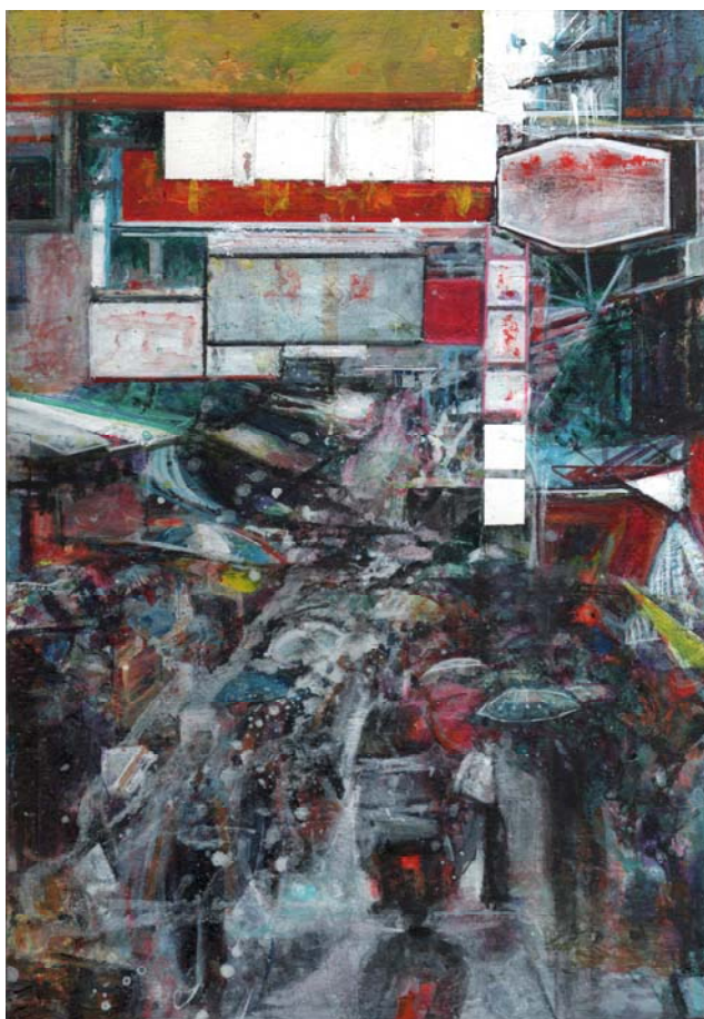
Ana Gonzalez Sola, Marché à Tokyo, 27 x 19 cm