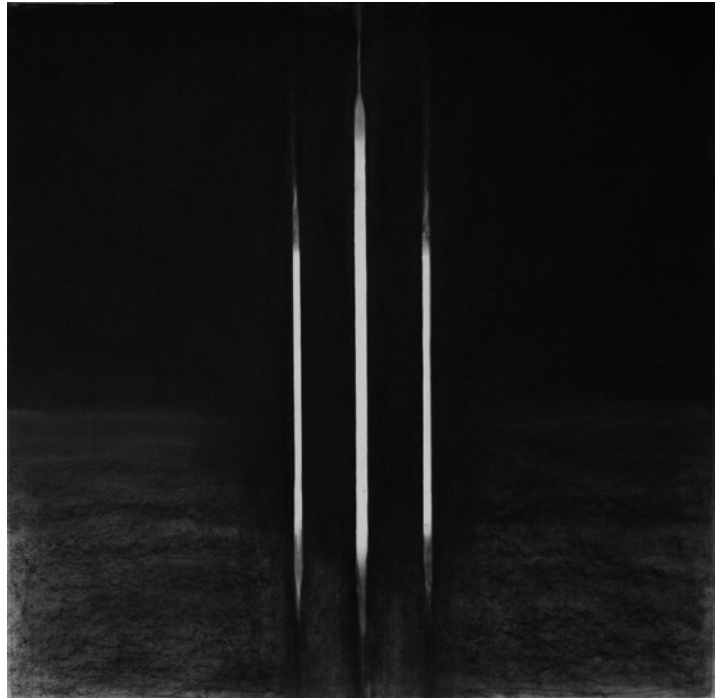
Station III, pastel sec noir, 100 x 100 cm

Un fil de lumière dans les profondeurs de l'abîme, un écheveau de strates qui font comme des architectures à la Piranèse, des lignes droites qui sont comme des grossissements, des barres d'acier grâce auxquelles on élève nos demeures, des trous qui semblent des fenêtres lors même que l'on ignore dans quel monde nous nous trouvons, et voilà que se met en place, sous nos yeux, l'infemale machine à imaginer.