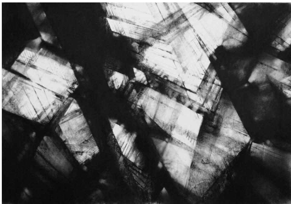
Pyramides, pastel sec, 70 x 100 cm