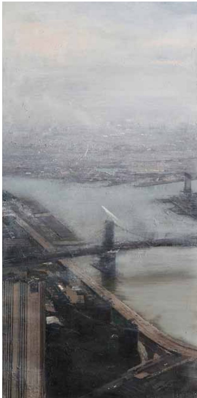
«NY gris», huile sur bois, 160 x 80 cm, 2008-2011