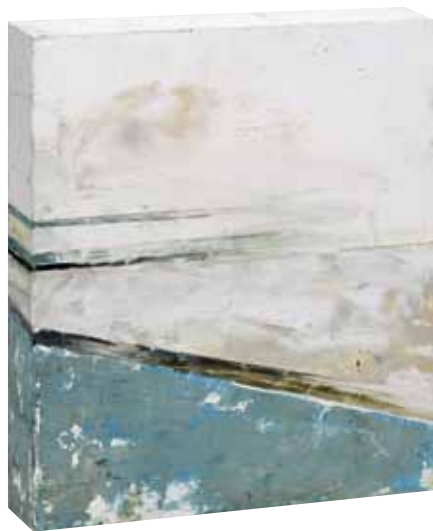
« Hors murs II », mixte sur bois double face, 30 x 26 cm, 2012