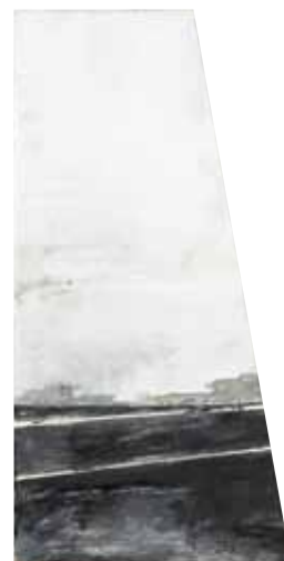
« Entail I », dyptique, huile sur bois, 43 x 50 cm, 2012