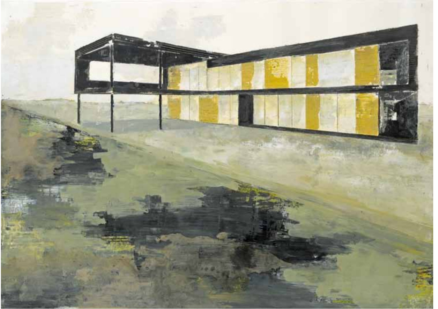
«Herbst serie Wien VI», mine de plomb et huile sur papier, 50 x 70 cm, 2011