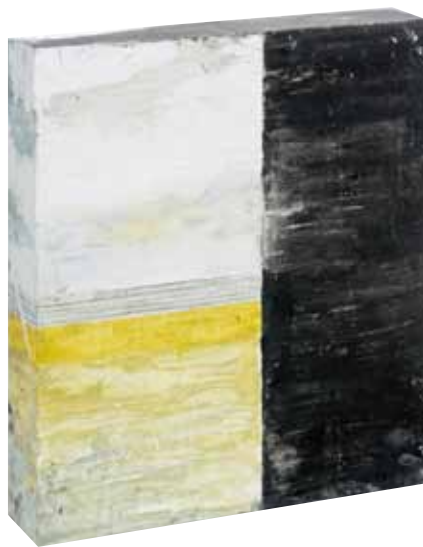
« Hors murs I », mixte sur bois double face, 30 x 26 cm, 2012