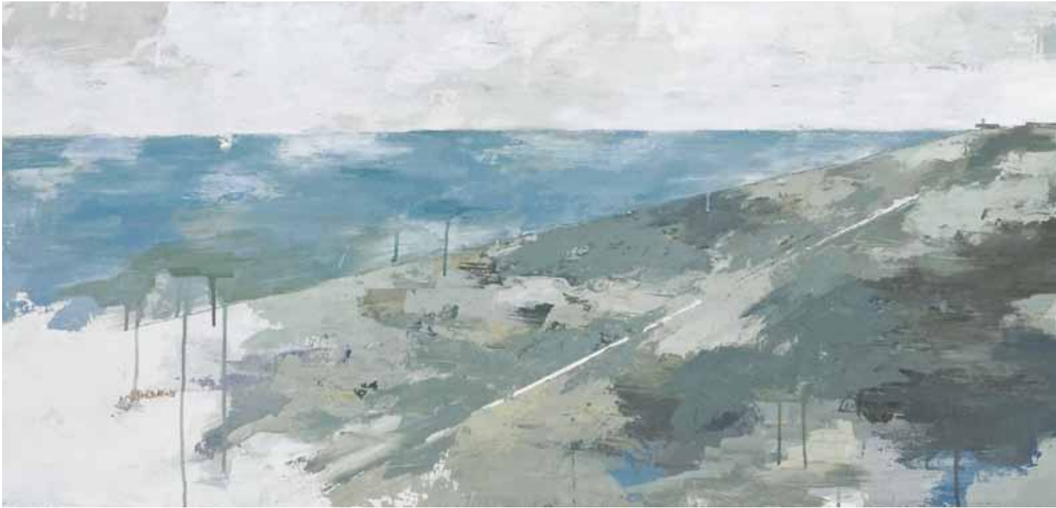
« Donau Insel », huile sur bois, 50 x 210 cm, 2011