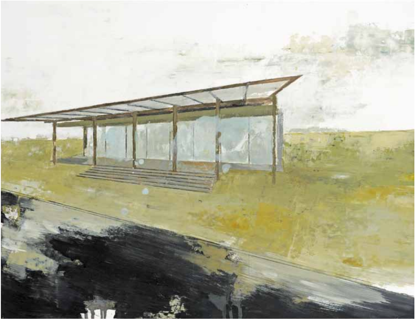
« Herbst serie Wien VII », 50 x 65 cm, mine de plomb et huile sur papier, 2011