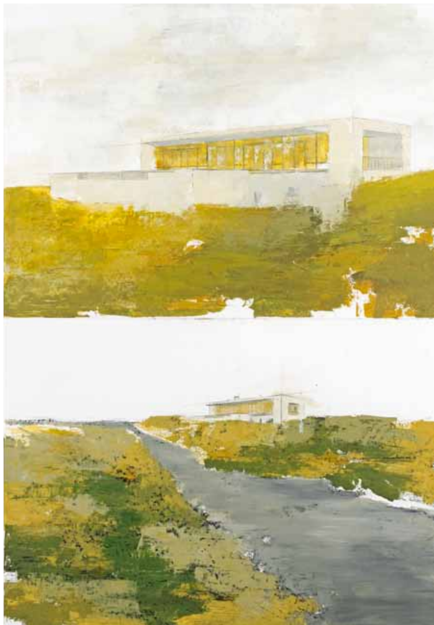
« Dubble mind », technique mixte sur papier, 100 x 70 cm, 2011