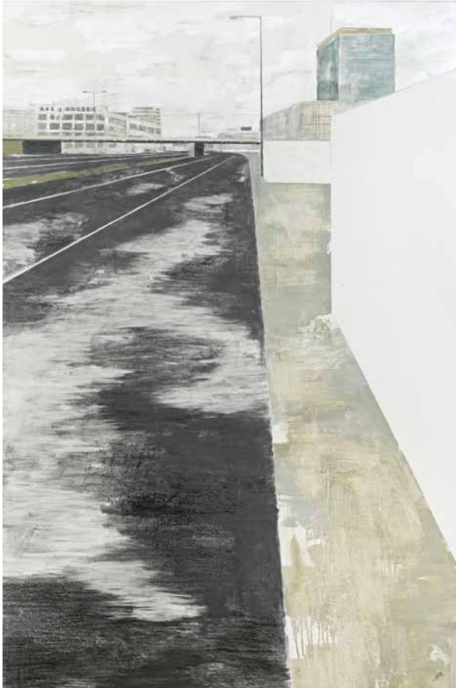
« Berliner Mauer », huile sur toile, 200 x 135 cm, 2012