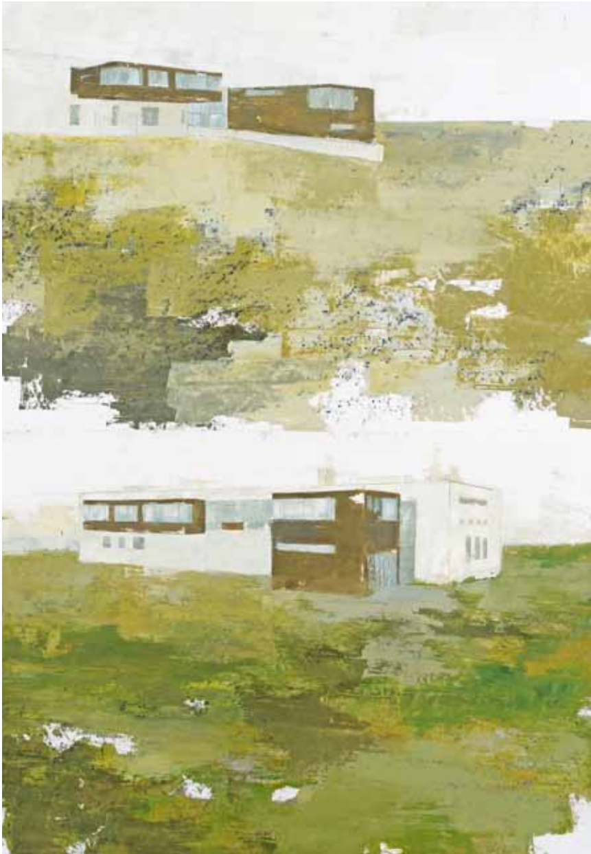
« Up and down », technique mixte sur papier, 100 x 70 cm, 2011