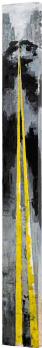
« Dubble yellow », huile sur toile, 195 x 23 cm, 2012