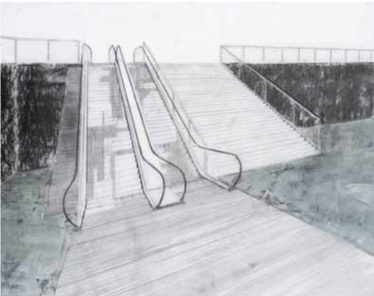
« Rolltreppe VIII », technique mixte sur calque, 35 x 44 cm, 2012