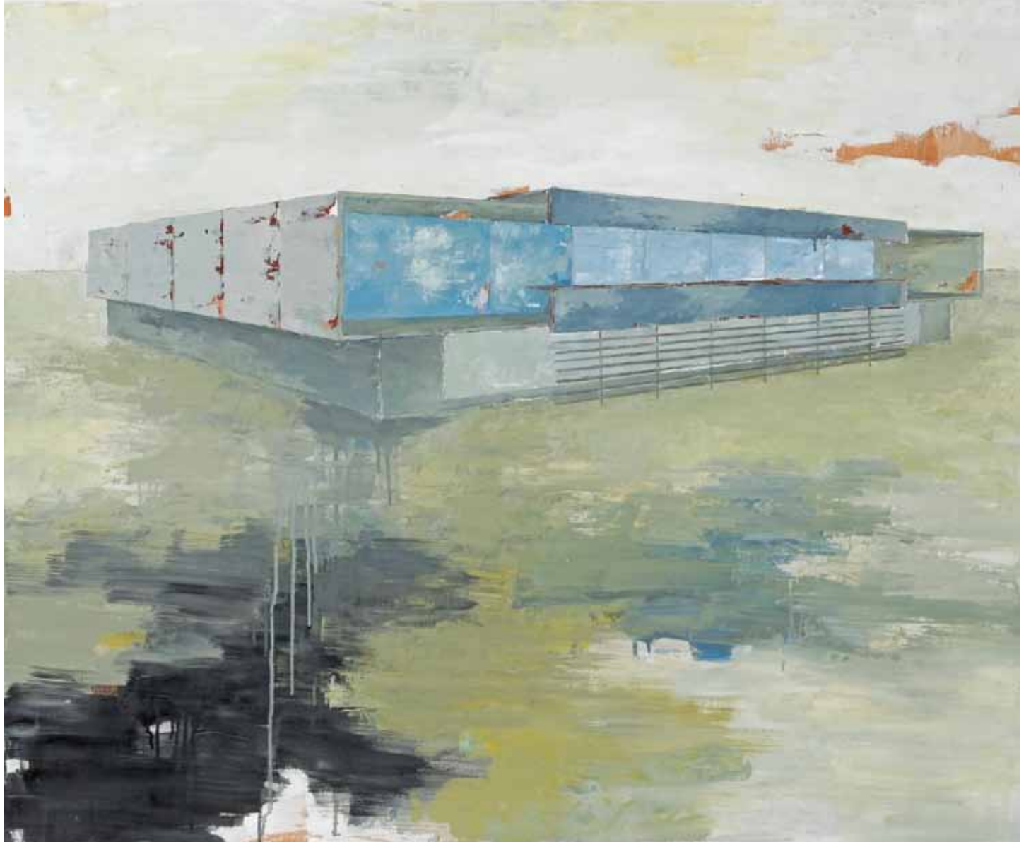
« Ventana House », huile sur bois, 95 x 116 cm, 2011