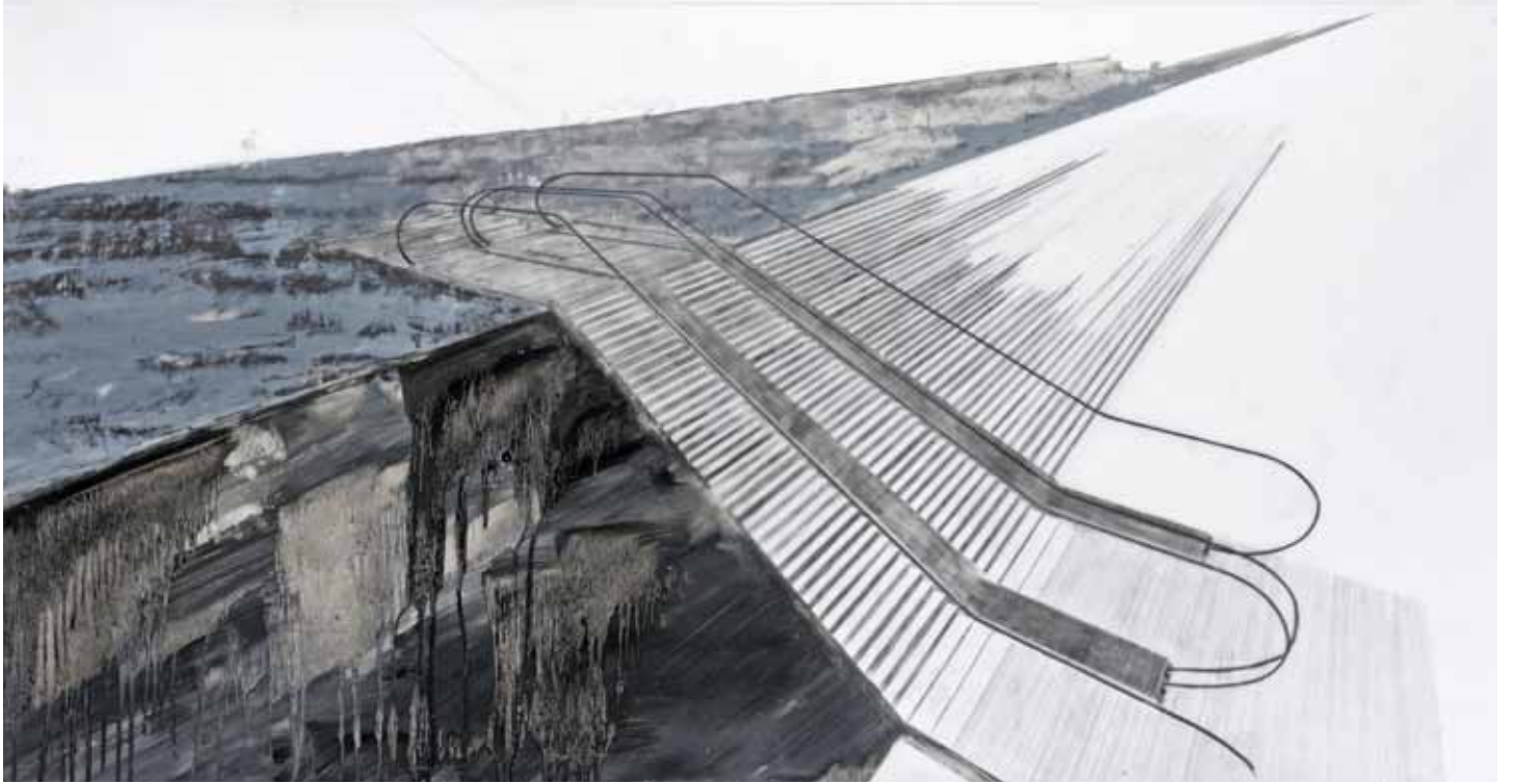
« Rolltreppe IV », technique mixte sur calque, 65 x 120 cm, 2012