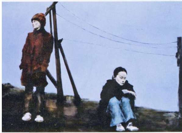
Gabriel Schmitz Hokkaido, 2009 Huile sur toile, 114 x 162 cm