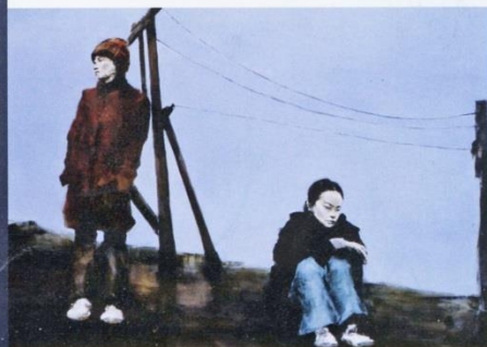
Gabriel Schmitz Hokkaido, 2009 Huile sur toile, 114 x 162 cm © G. Schmitz Galerie Arcturus

Galerie Le Réalgar 23, rue Blanqui 42000 Saint-Étienne Port. +33 (0)6 87 60 22 34 Jusqu'au 20 mai 2010