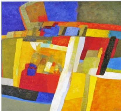
Maurice Estève Ratuel, 1975 Huile sur toile, 60 x 73 cm Collection particulière