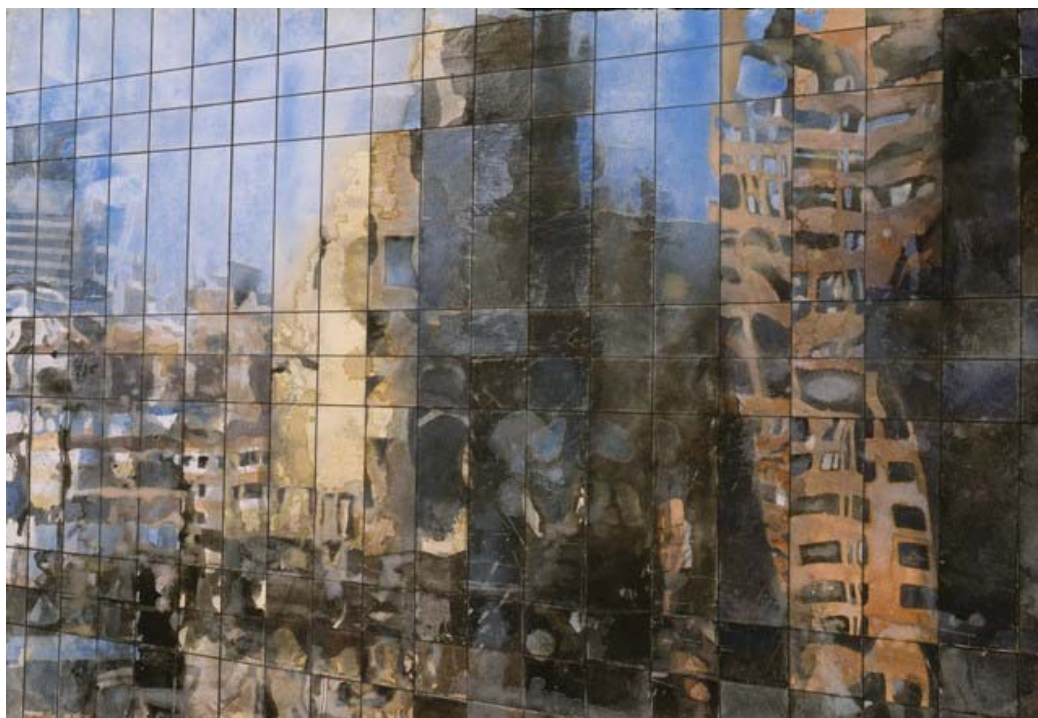
« Aerial reflection I », aquarelle, 57 x 39, 5 cm, 2010