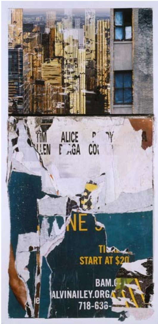
« Start at 20 $ », photo, collage, T. mixte, 85 x 39 cm, 2010