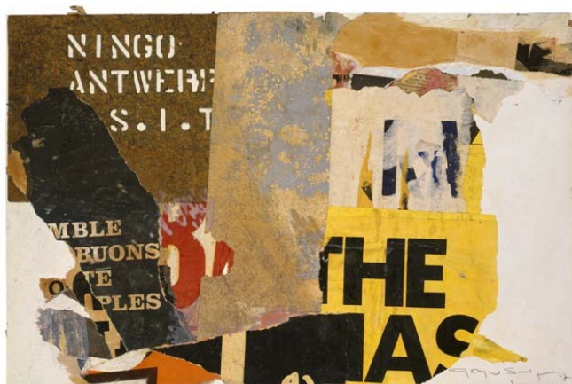
« Ningo Antwerp », decollage-recollage, 32,5x50 cm, 1967

Anne de la Roussière (06 80 16 15 88) Galerie Arcturus 65, rue de Seine - 75006 Paris T : 01 43 25 39 02 – F : 01 43 25 33 89 arcturus@art11.com www.art11.com/arcturus