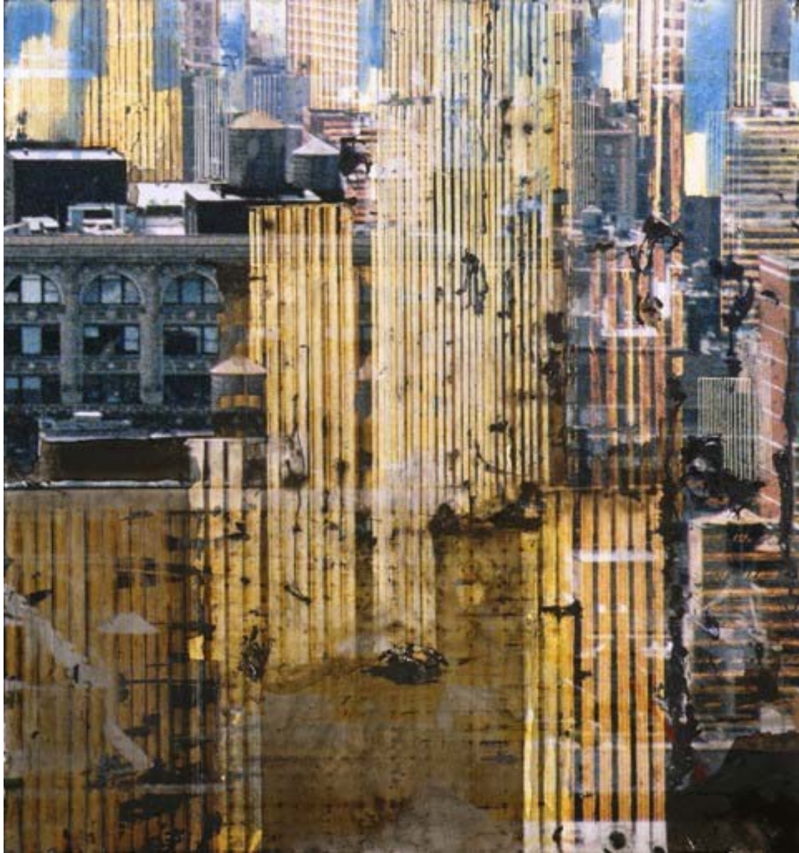
« From 29th street », photo, collage, T. mixte, 33 x 30,5 cm, 2009