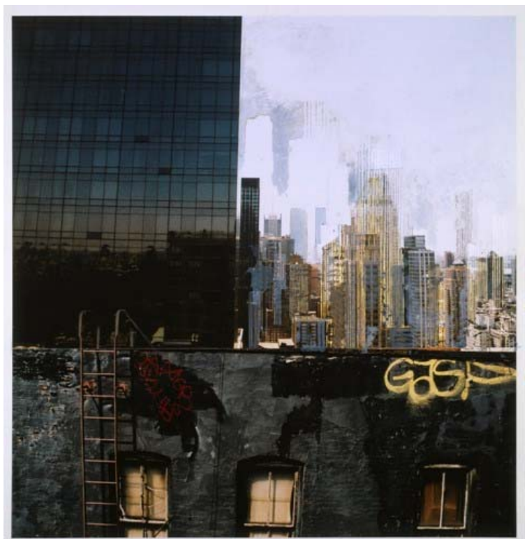
« Gasp », photo, collage, T. mixte, 85 x 80 cm, 2010