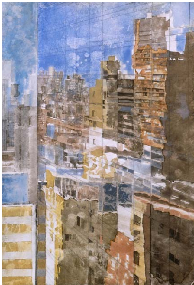
« Queensboro reflection », aquarelle, 48,5 x 30 cm, 2010