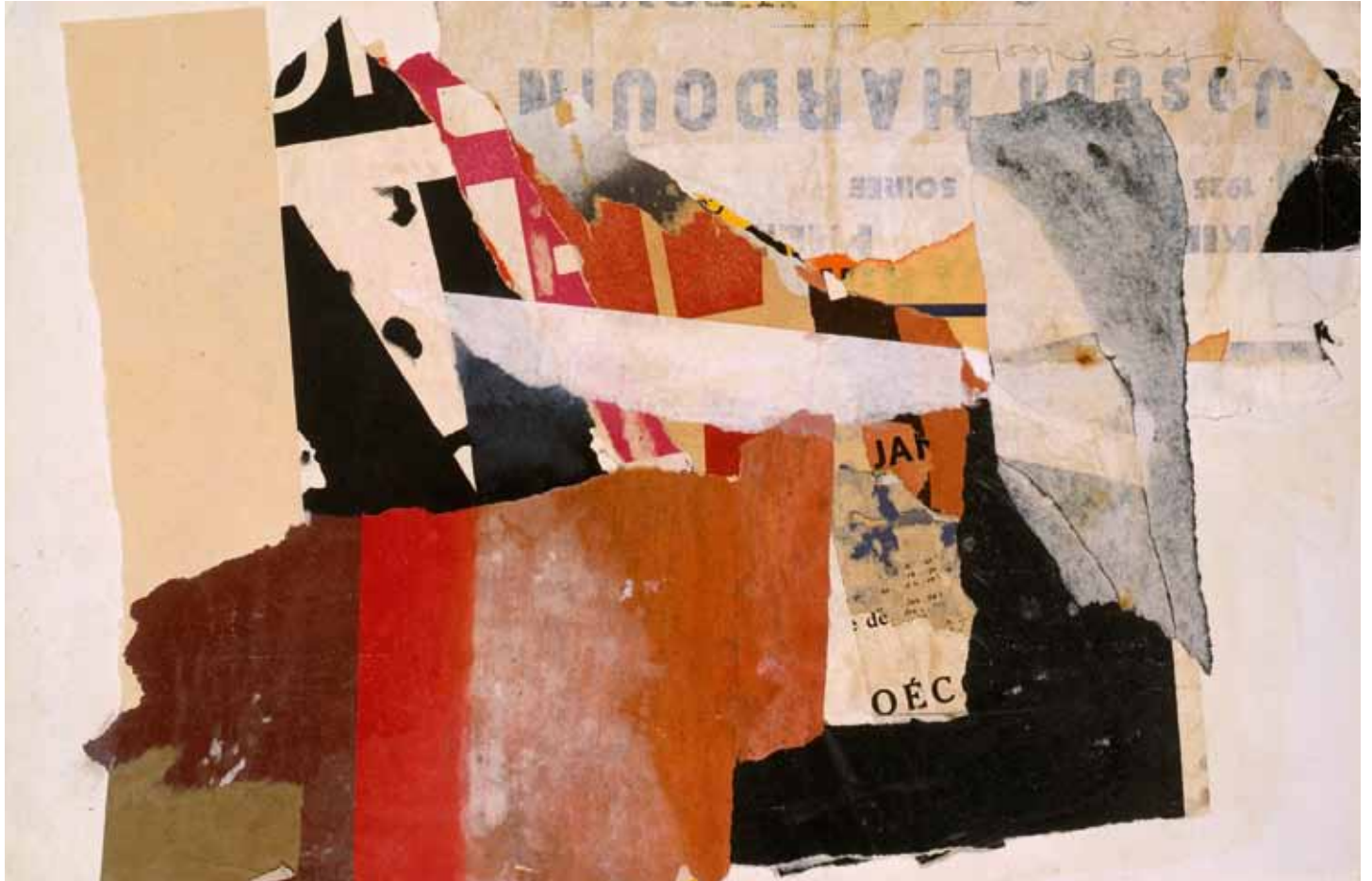
"Hardouin", décollage - recollage, 32,5 x 50 cm, 1967