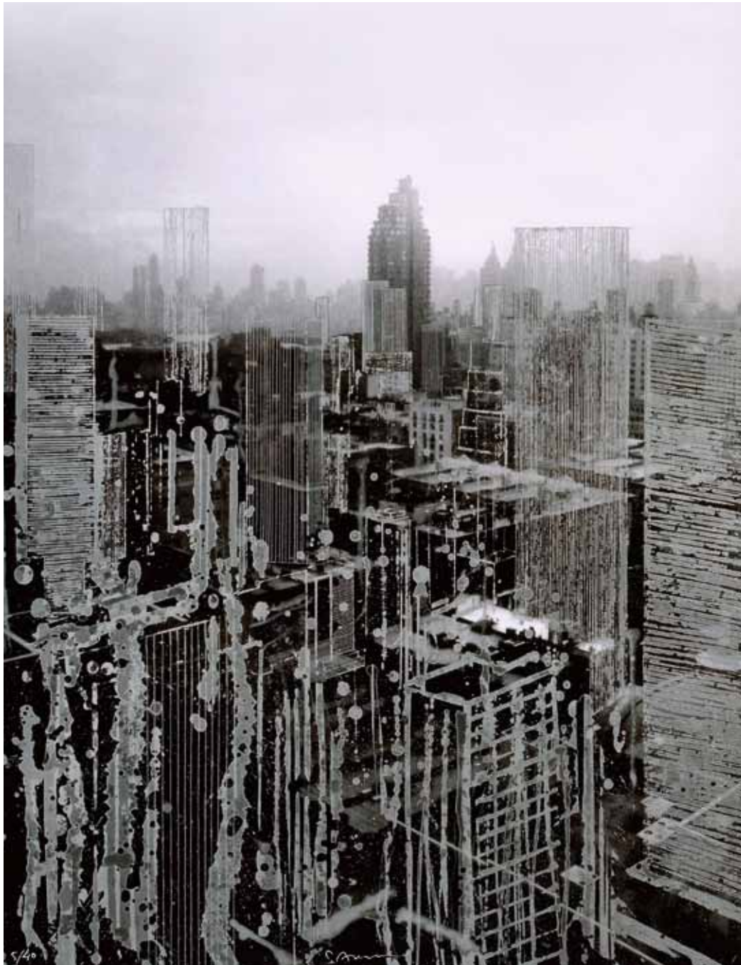
"Silver buildings", photogravure, 75 x 50 cm, 2010