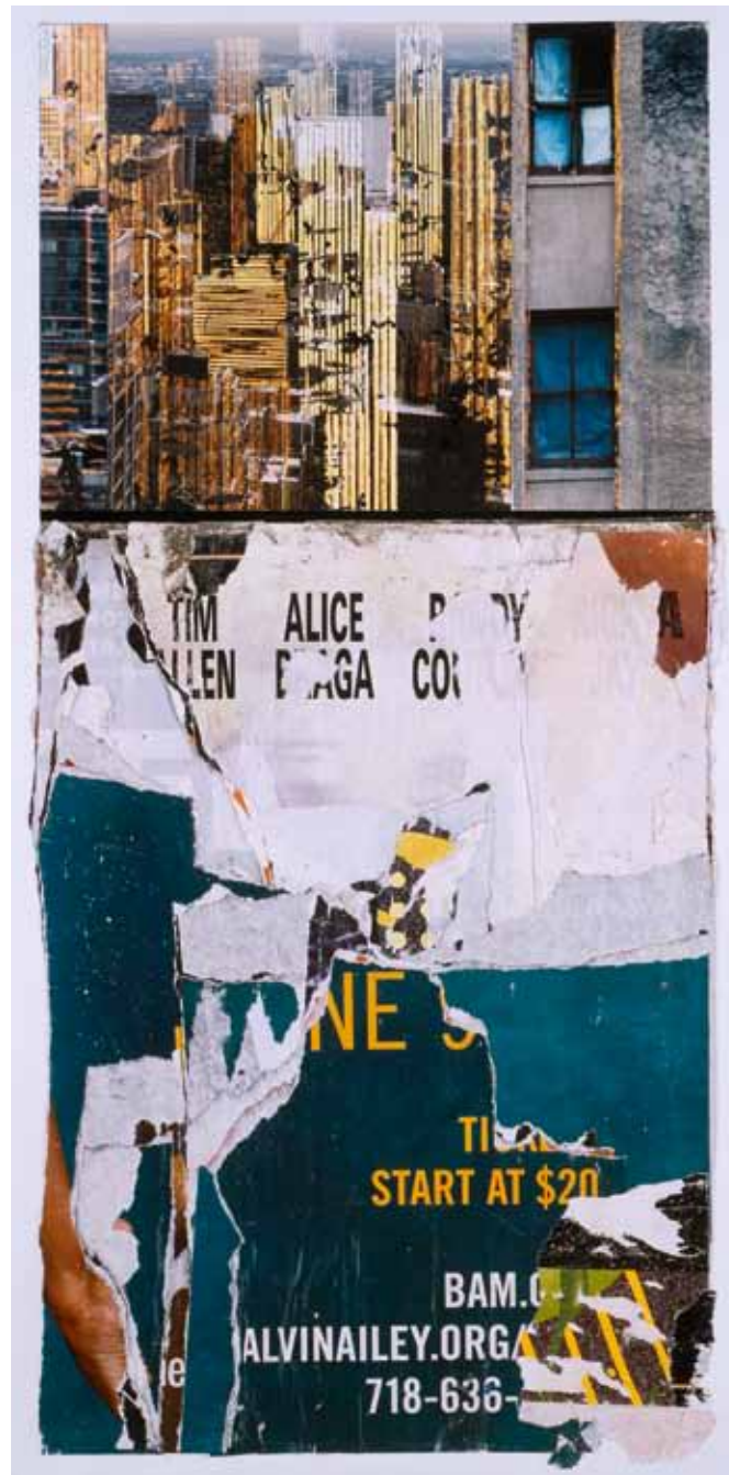
"Start at $ 20", photo, collage, technique mixte, 85 x 39 cm, 2010