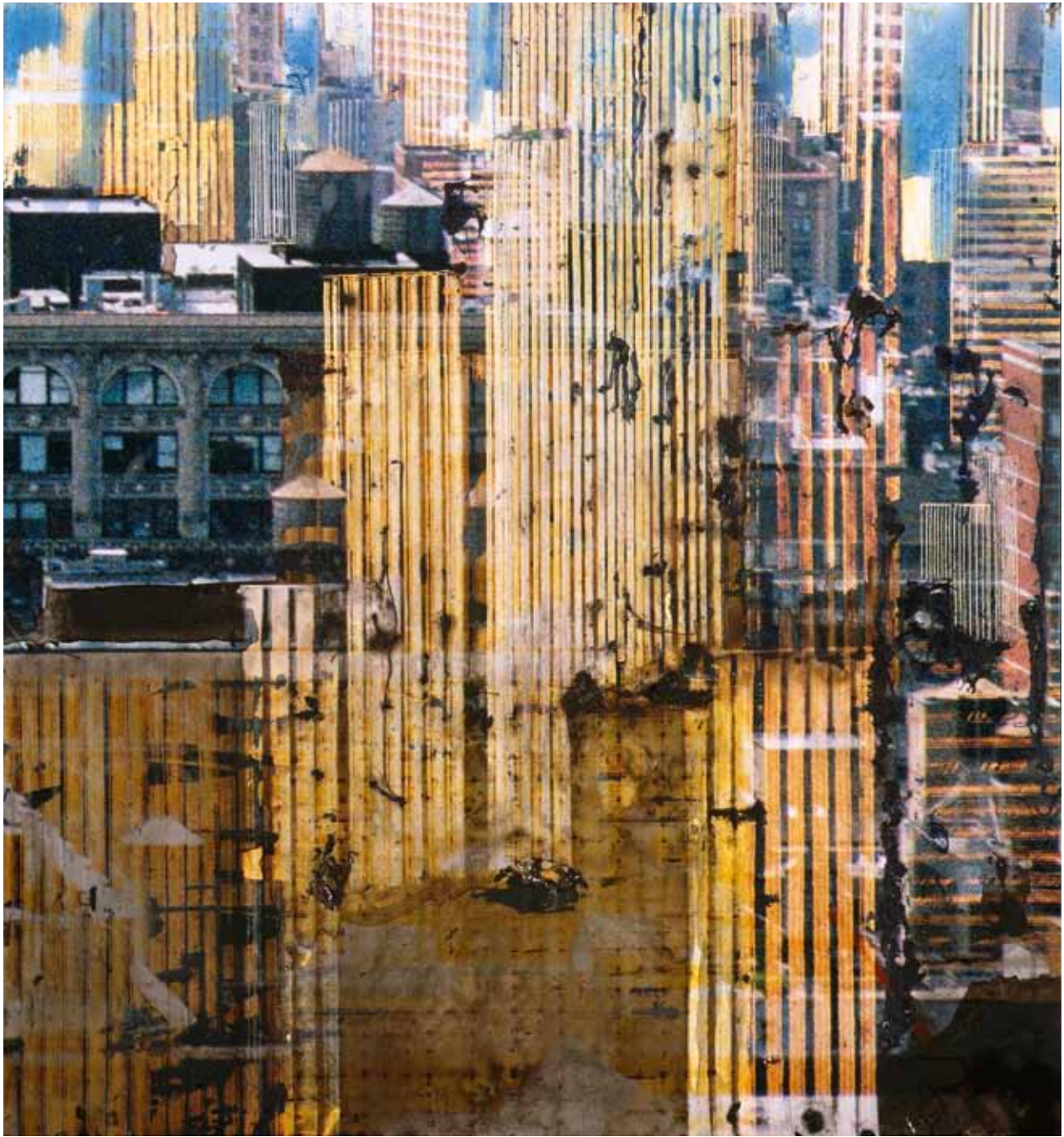
"From 29th street", photo, technique mixte, 33 x 30.5 cm, 2009