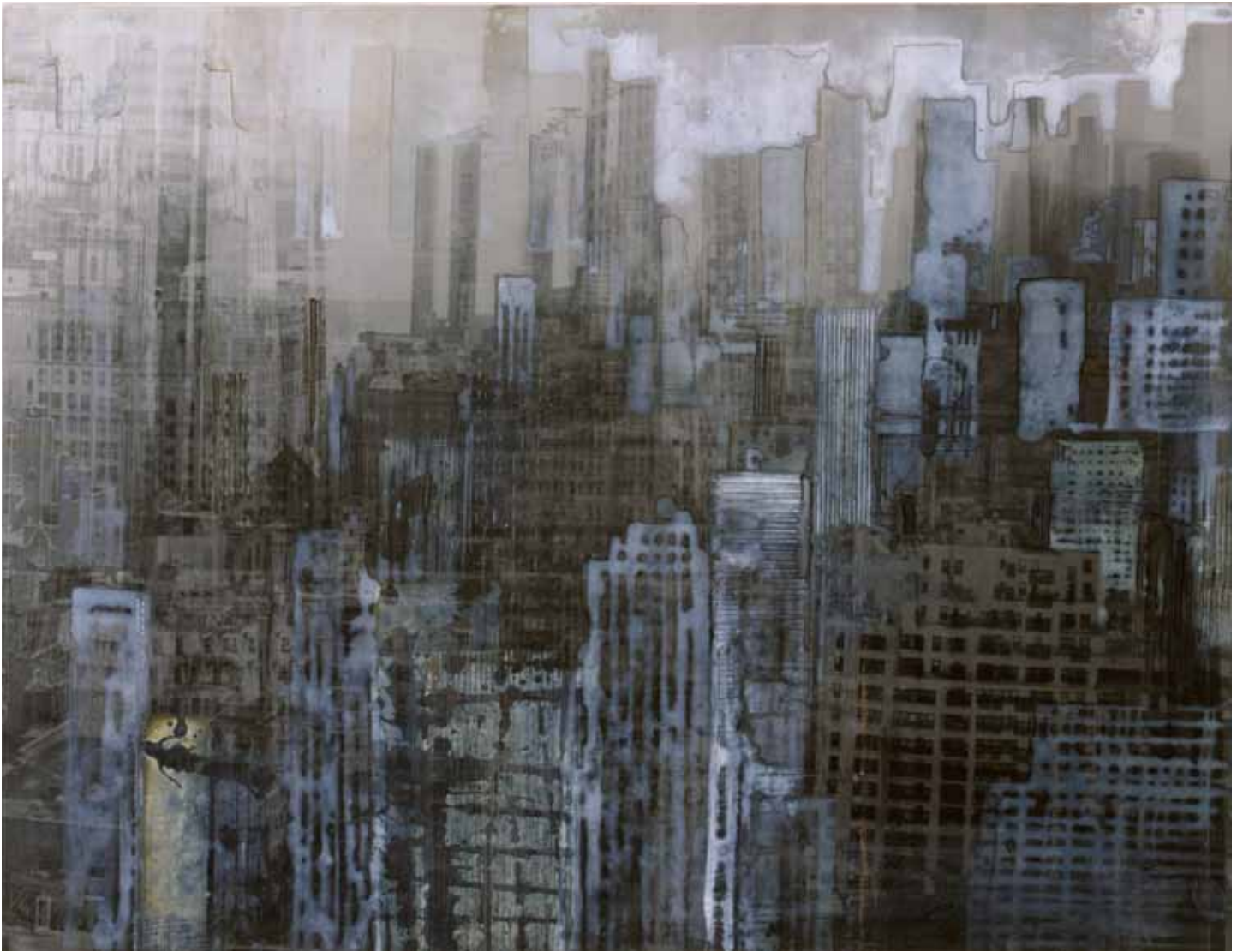
"NY photographique", photo, aquarelle, 38,5 x 50 cm, 1996