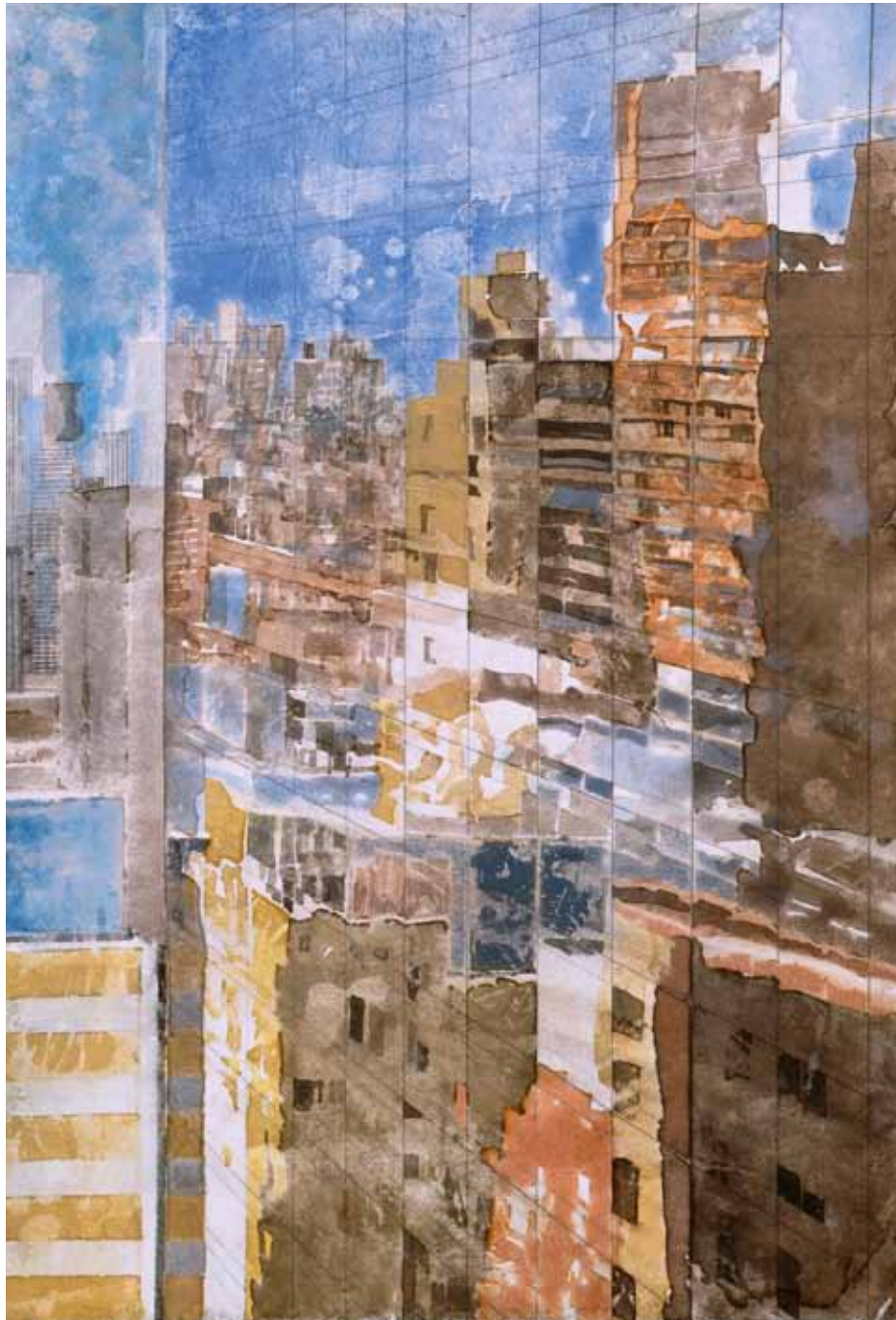
"Queensboro reflection", aquarelle sur papier, 48,5 x 30 cm, 2010