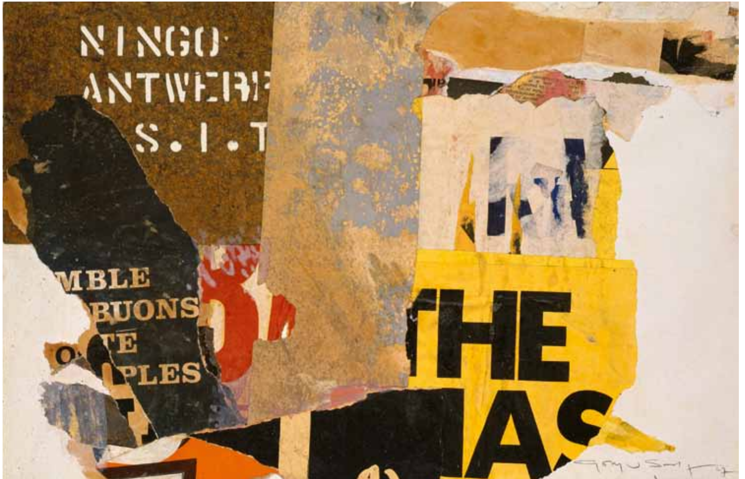
"Ningo Antwerp", décollage - recollage, 32,5 x 50 cm, 1967