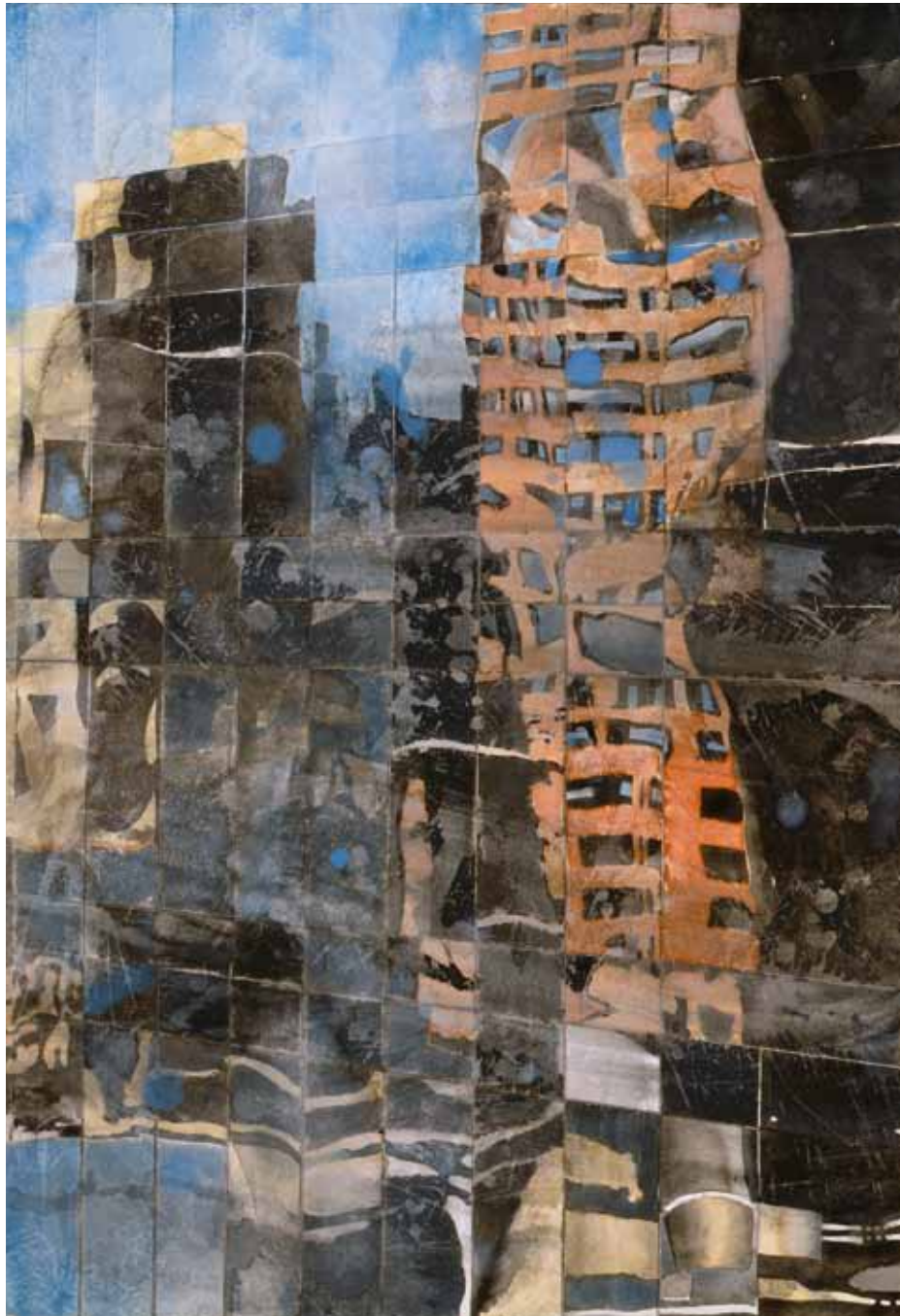
"Aerial reflection II", aquarelle sur papier, 57 x 39,5 cm, 2010