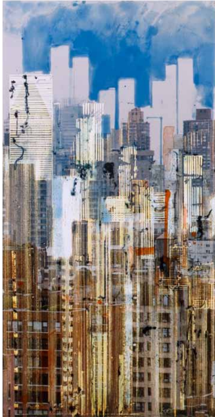
"From upperwest side", photo, technique mixte, 50 x 25 cm, 2009