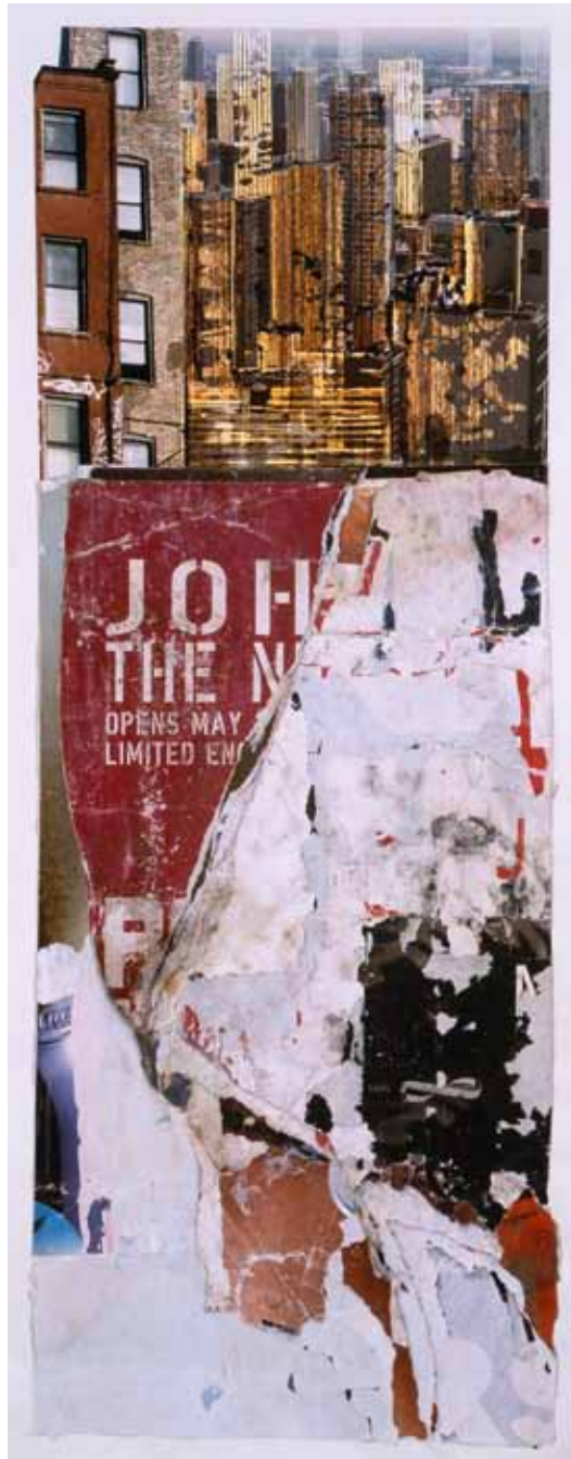
"Jo H", photo, collage, technique mixte, 94 x 39 cm, 2010