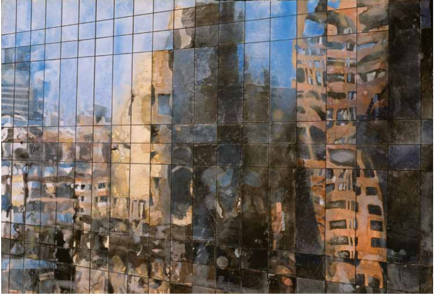
"Aerial reflection I", aquarelle sur papier, 57 x 39,5 cm, 2010