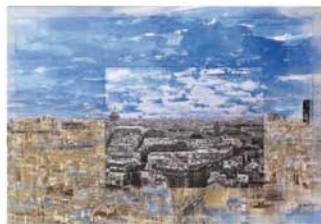
«Paris» - aquarelle photo - 89 x 130 cm 2003/2007

L'esthétique de la surface pure, qui exclut tout