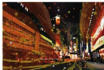
«NY FEB 3 (Lehman Brothers)» - Photoforte 50 x 75 cm - 2008

Attiré par la ville et ses tonalités, il en étudie les multiples couleurs qu'il emprunte notamment aux grandes villes américaines :