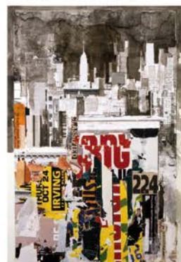
«Irving Place» - Acrylique et collage sur photo, marouflé sur toile - 130 x 89cm - 2008

grés. A New York, ils ont en partie entre 60 et 70 ans et de là naît le charme. On sent le fugitif. Les gratte-ciel sont exposés depuis des décennies aux éléments, ils se désagrègent, des couches de murs s'effritent, des couches de couleurs s'effacent, ternissent et disparaissent dans le fond, le plâtre s'émiette, des traces de rouille coulent le long des murs ».