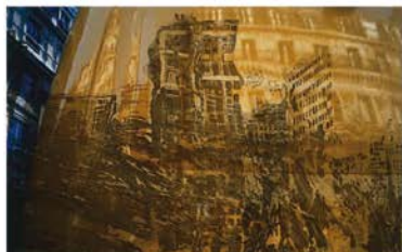
«Paris, reflet» - Photoforte - 30 x 47 cm - 2005

Maître de l'aquarelle, coloriste délicat, Gottfried Salzmänn utilise l'infinité des tonalités