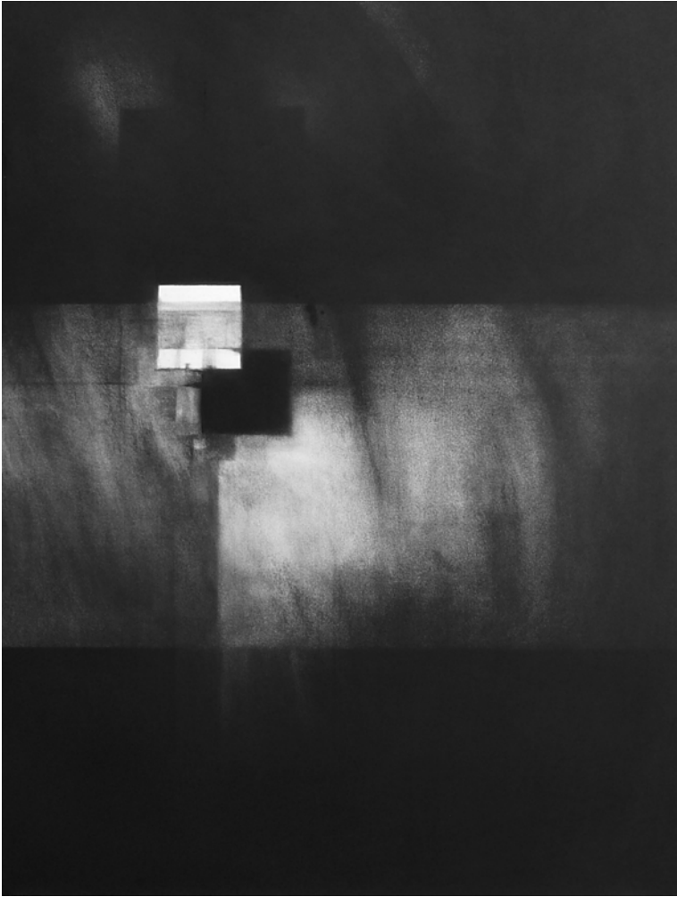
Carré flottant, pastel sec, 80x 60 cm