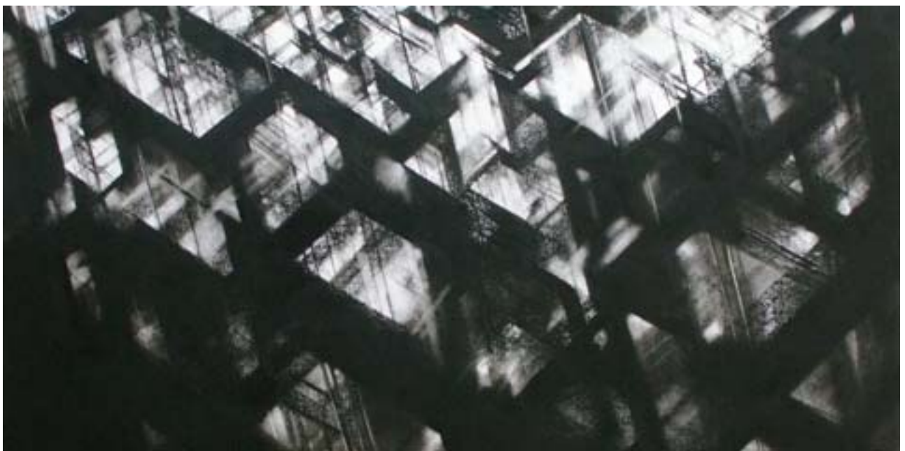
Surplomb (détail), pastel sec, 100 x 100 cm, 2009