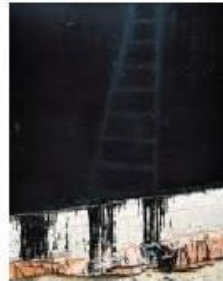
Hervé Abbadie, « Meudon IV », tirage argentique, 120 x 95 cm

Hervé Gloaguen, « Jazzmen, photographies » - « À hauteur de Jazz », Éd. La Martinière, 31 mars > 25 avril