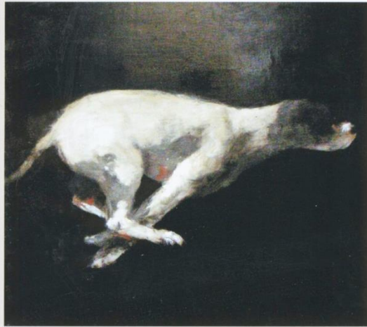
Miguel Macaya, Chien , 2008, huile sur bois, 122 x 122 cm, galerie Arcturus, Paris.