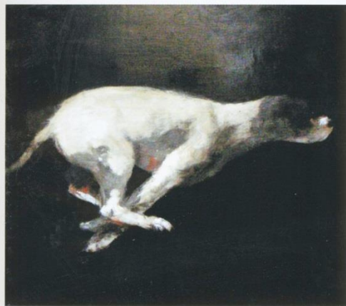
Miguel Macaya, Chien , 2008, huile sur bois, 122 x 122 cm, galerie Arcturus, Paris.

Galerie Arcturus, Paris Du 29 mai au 28 juin 2008