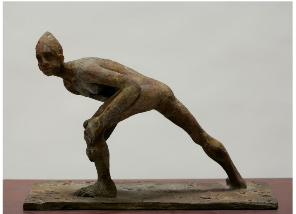
« Ninfa » - Bronze - 19 x 29 x 12 cm