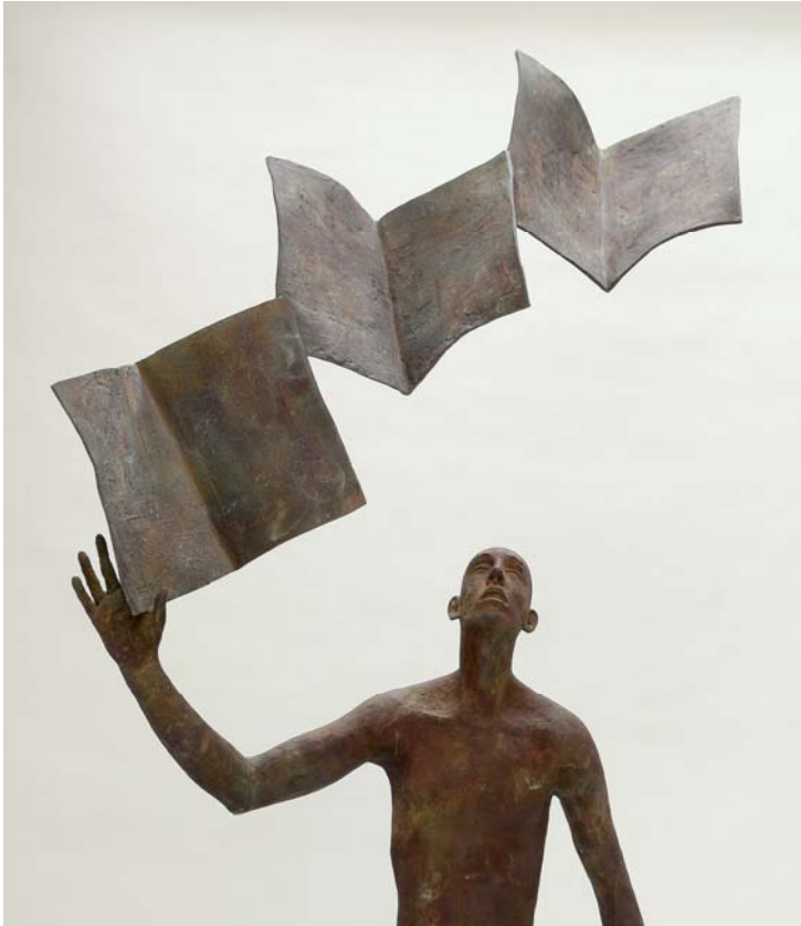
« Levedad » - Bronze - 230 x 120 x 50 cm