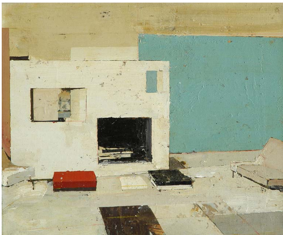
Simboles Conventionales, 2007 , Technique mixte sur toile, 38 x 46 cm

Et c'est bien cette tension à la fois secrète, intime et sourde que peint Regina Gimenez. C'est cette tension qui organise sa manière même de peindre. Ainsi les grands à-plats ou les surfaces peintes représentant des éléments architecturaux sont d'une matière qui est aussi trouble et profonde que le fond de nos sensations et les lignes anguleuses aussi acérées que notre regard. Entre les deux, nous passons, figures dans un théâtre que nous avons construit et que nous ne savons pas reconnaître comme étant le nôtre. C'est ce sentiment d'étrangeté que nous communique de manière magistrale la peinture de Regina Gimenez.