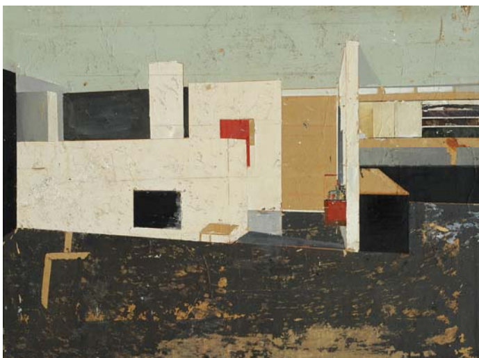
Coventionales, 2007, Technique mixte sur toile, 97 x 130 cm