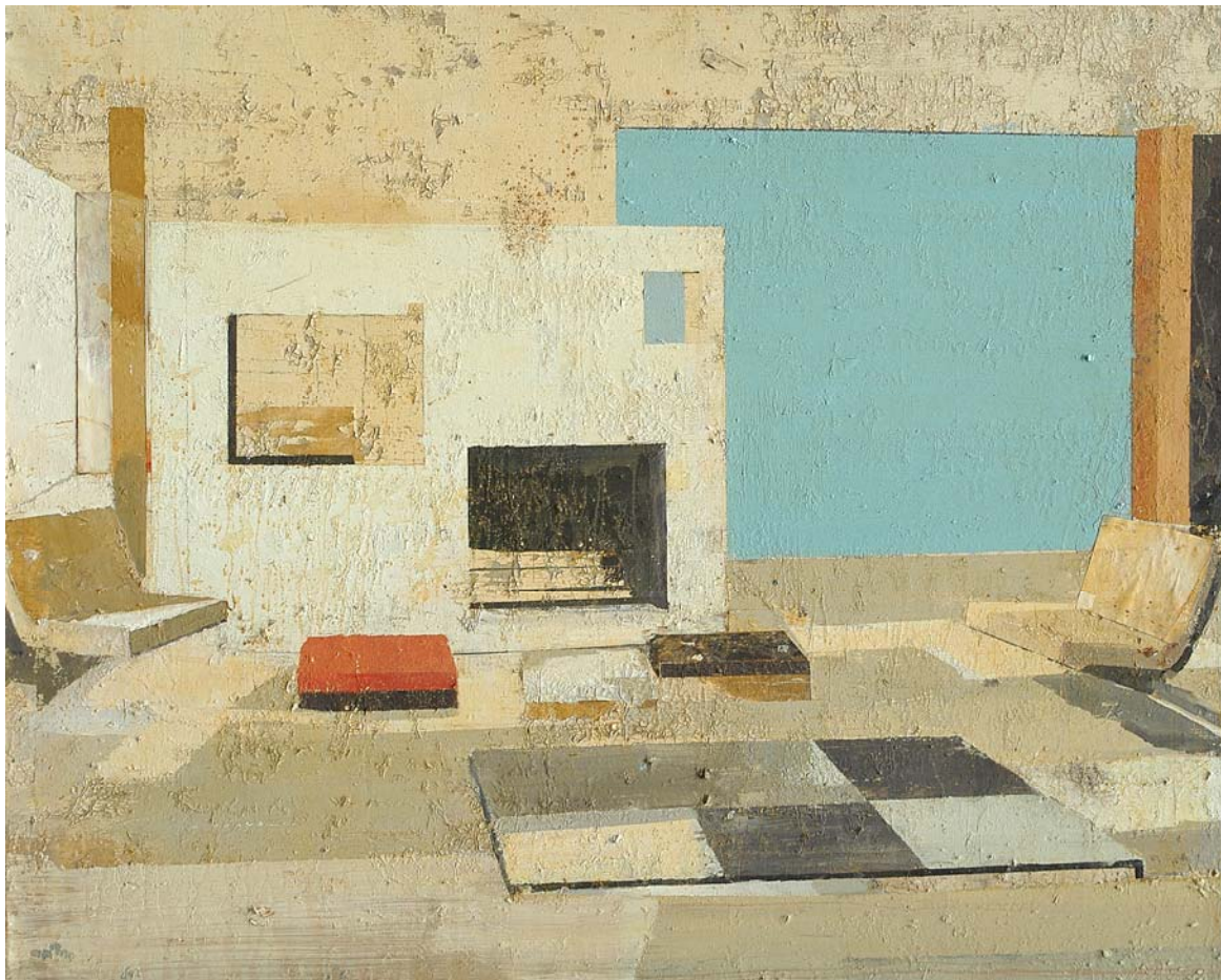
Simboles Conventionales, 2007, Technique mixte sur toile, 130 x 162 cm