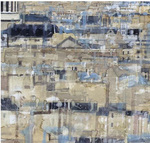
« Paris, le Panthéon (détail) » - Aquarelle - 47,6 x 30,1 cm - 2006