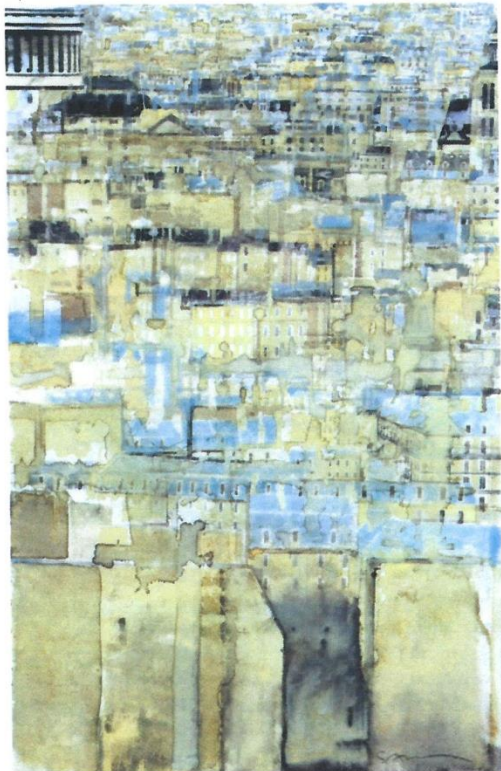
Paris, le Panthéon, 2006 - Aquarelle, 47,6 x 30,1 cm