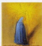
Piero Guccione, La Sicilia nel "Bacio" di Hayer, 2002, pastel, Galerie Claude Bernard.

L'œuvre de cet autodidacte démarre en 1973 alors qu'il est déjà en fauteuil roulant, atteint de myopathie. Jusqu'à son suicide en 2001 à l'âge de cinquante et un ans, il aura voué toute son énergie à l'art et connu la notoriété. Aux frontières de l'art brut, sa peinture est très expressionniste, de plus en plus obscure. Ses sujets grinçants.