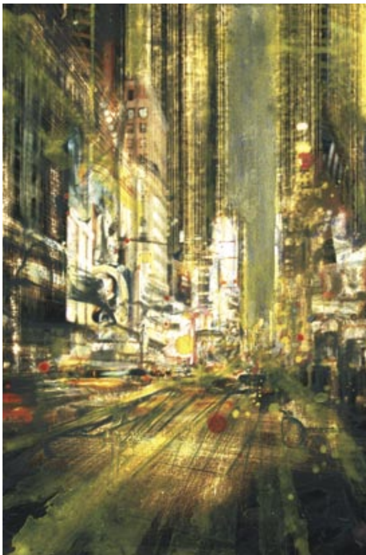
«NY la nuit» - Technique mixte sur photo - 44,8 x 30 cm - 2006