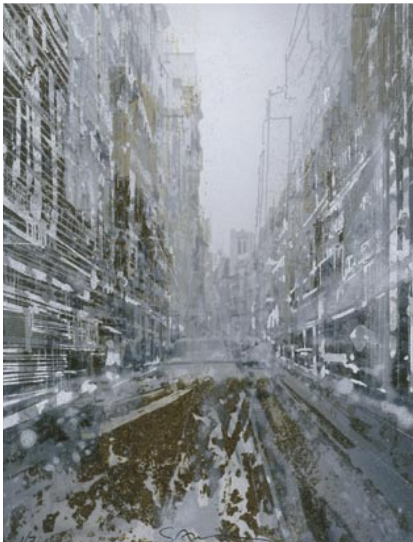
«Saint Nicolas des Champs» - Photostyle - 28 x 21 cm - 2006