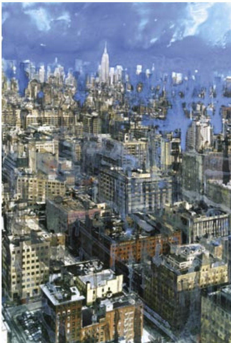
«NY liquide sky» - Technique mixte sur photo - 75,3 x 50,7 cm - 2006