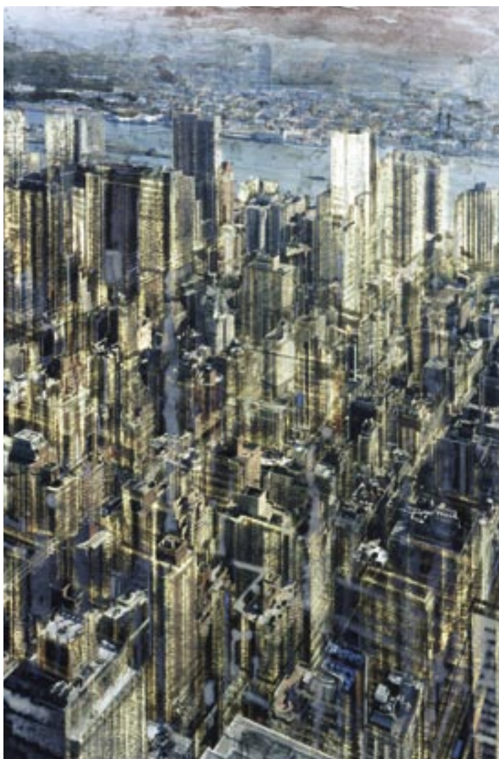
«NY East River» - Technique mixte sur photo - 75,9 x 50,7 cm - 2006