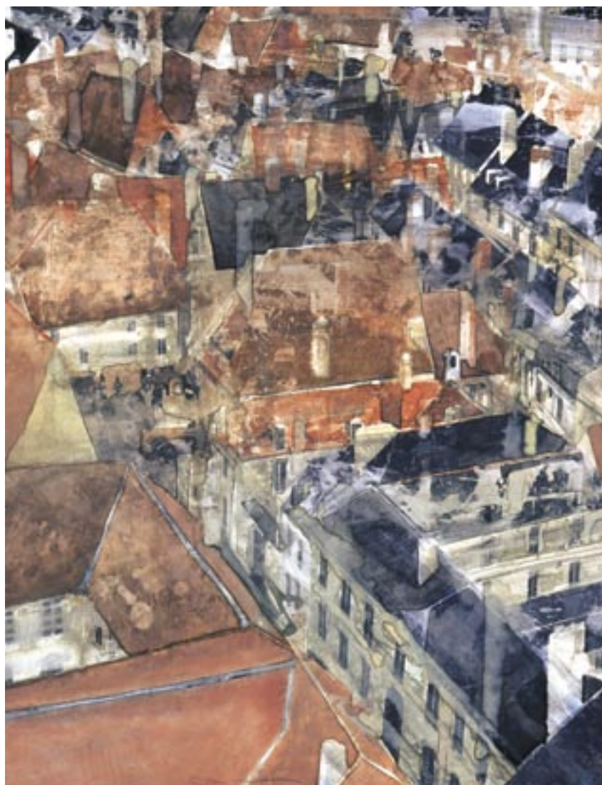
«Bourges I» - Aquarelle - 61 x 46,8 cm - 2006