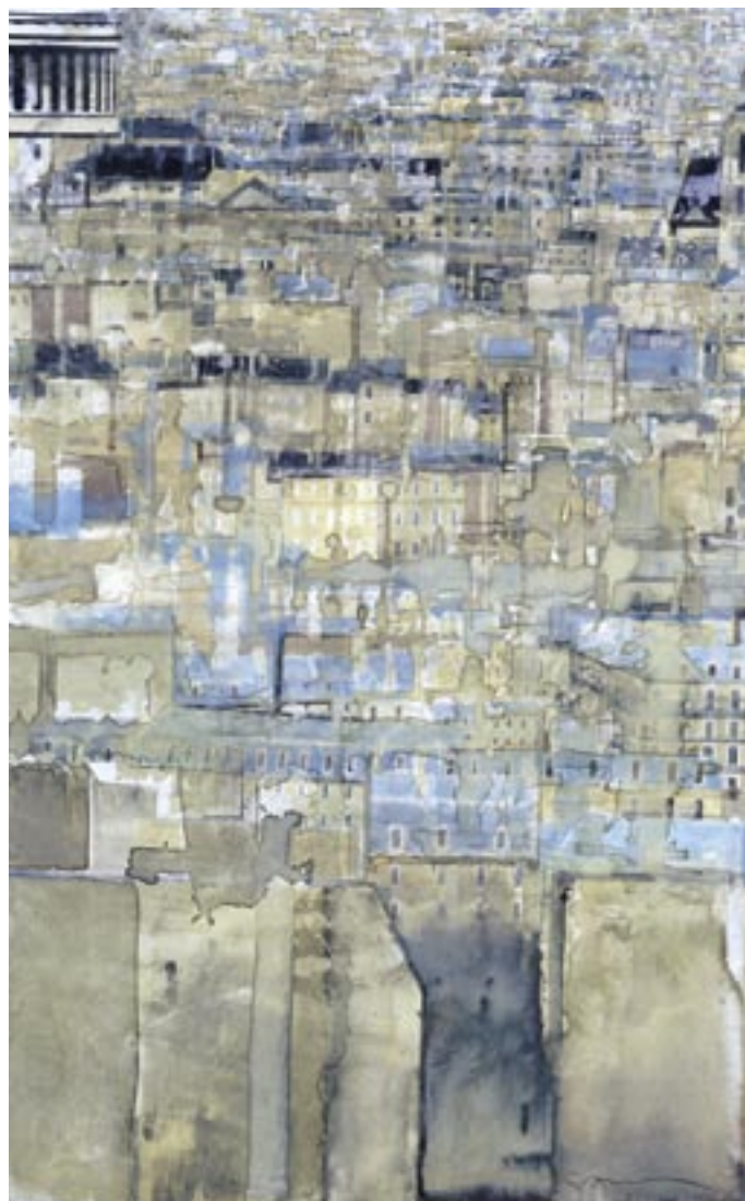
«Paris le Panthéon» - Aquarelle - 47,6 x 30,1 cm - 2006