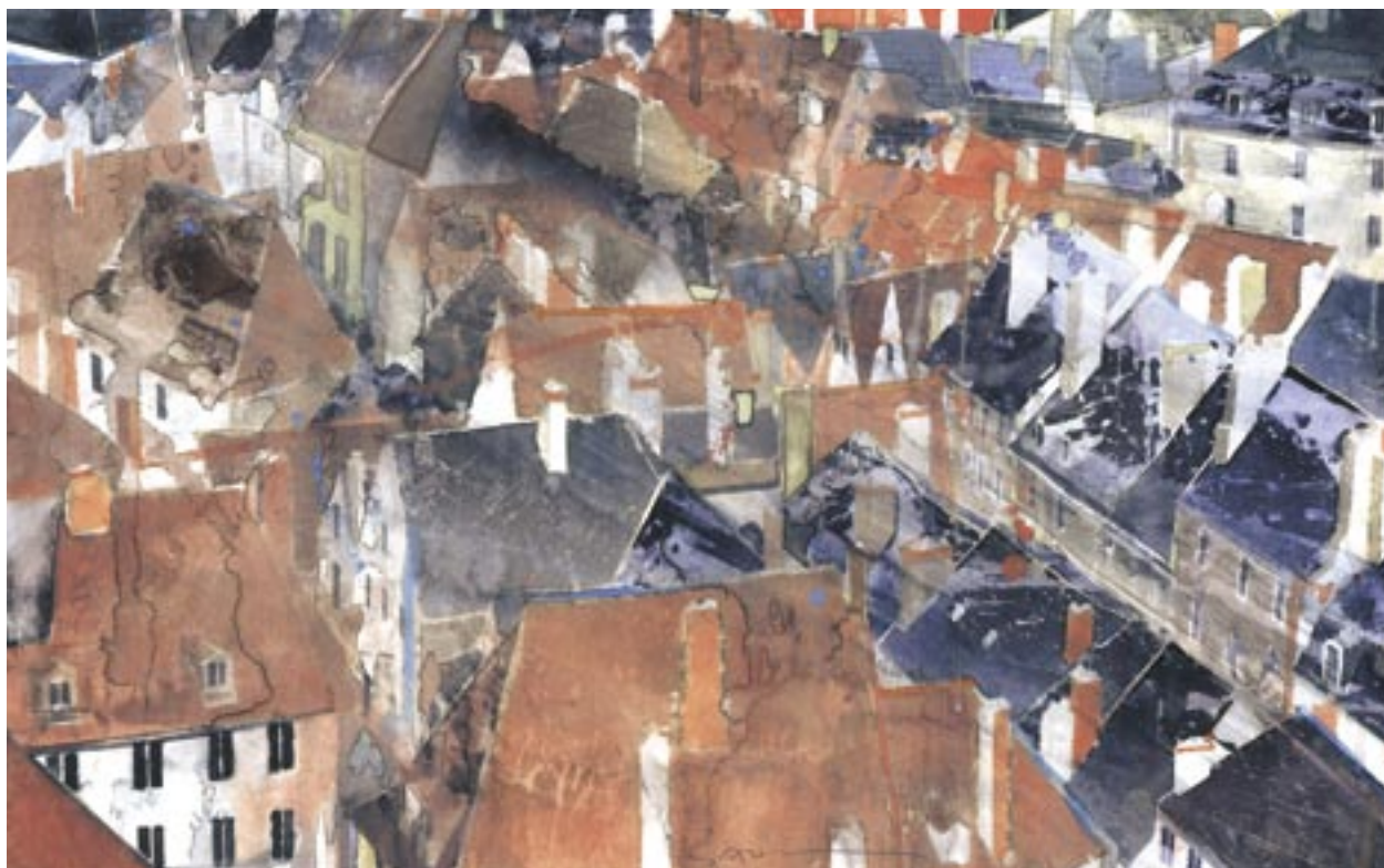
«Bourges II» - Aquarelle - 30 x 47,6 cm - 2006