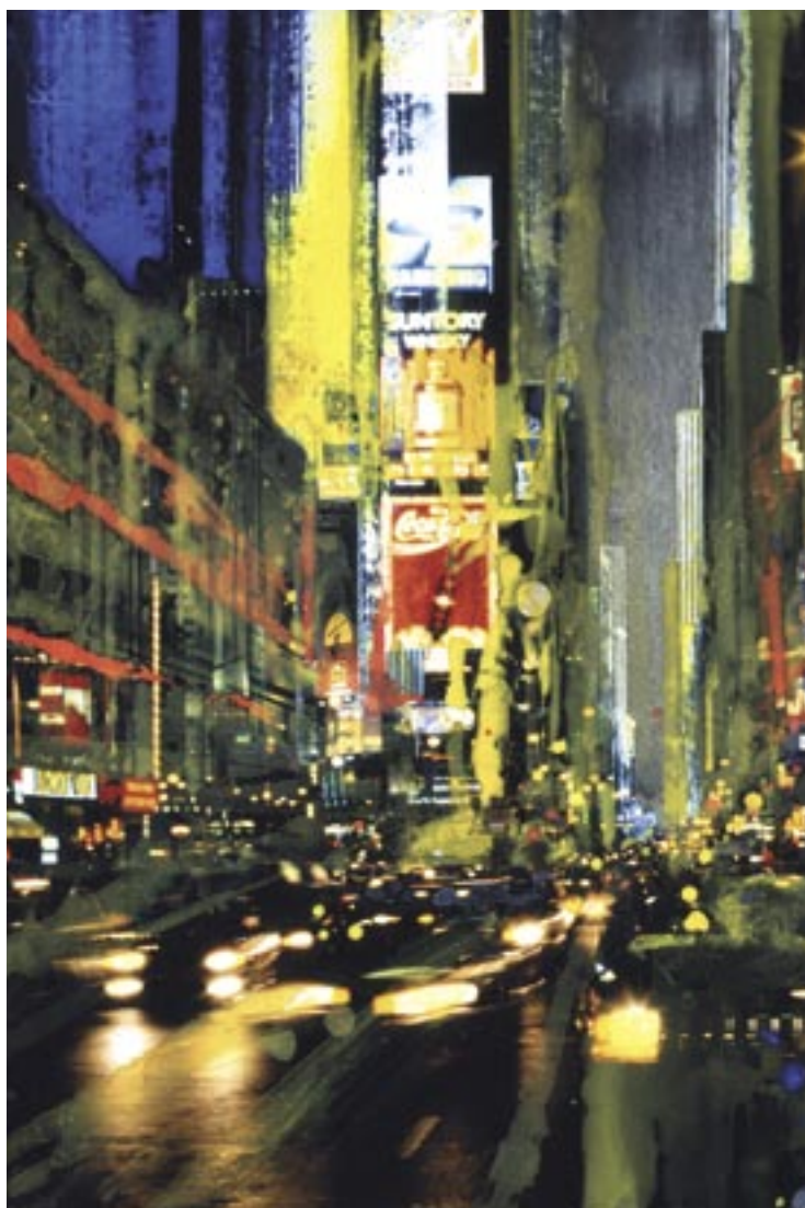
«NY Suntory» - Technique mixte sur photo - 75,9 x 50,5 cm - 2006