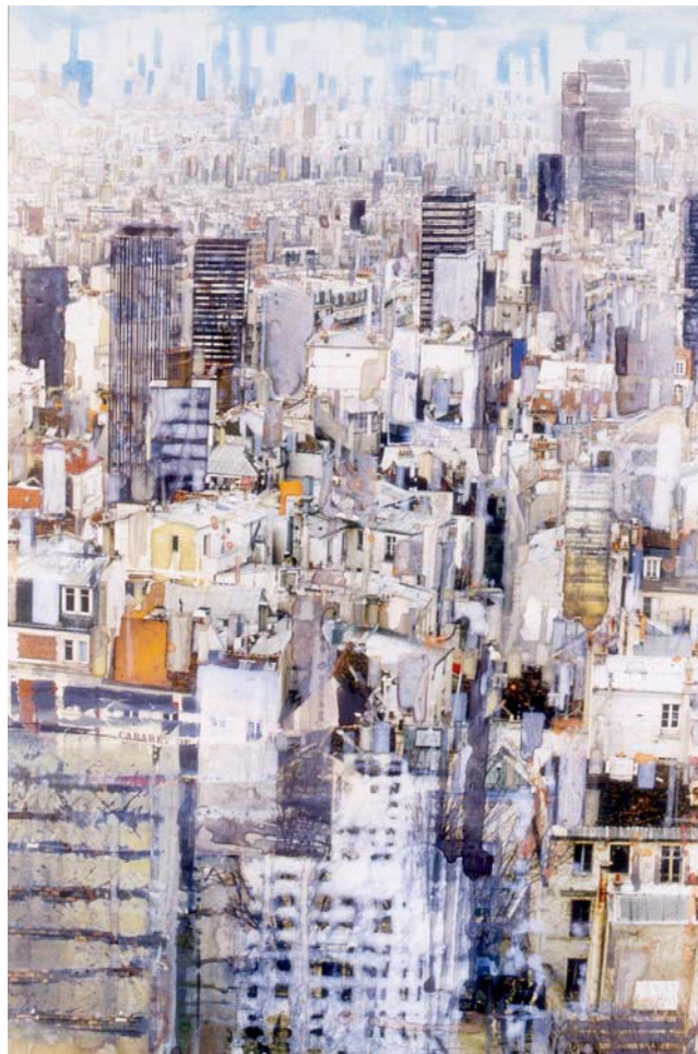
SALZMANN - Paris, les Tours - 75 x 50 cm - Aquarelle sur papier