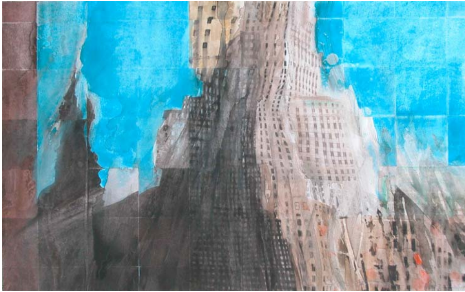
SALZMANN - New York, Reflets - 30 x 47 cm - Aquarelle sur papier