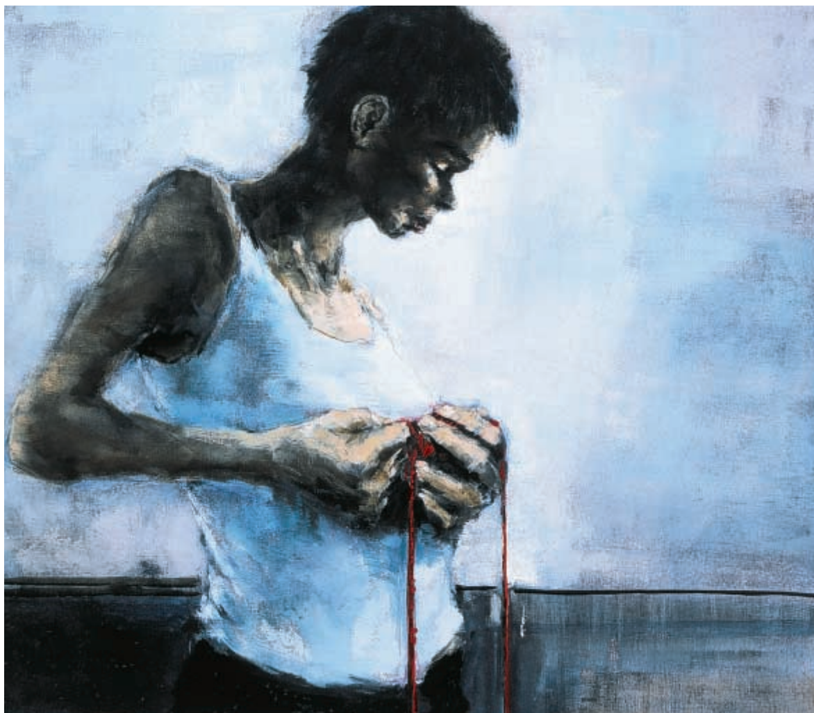
Fil de laine - huile sur lin - 70 x 80 cm - 2003