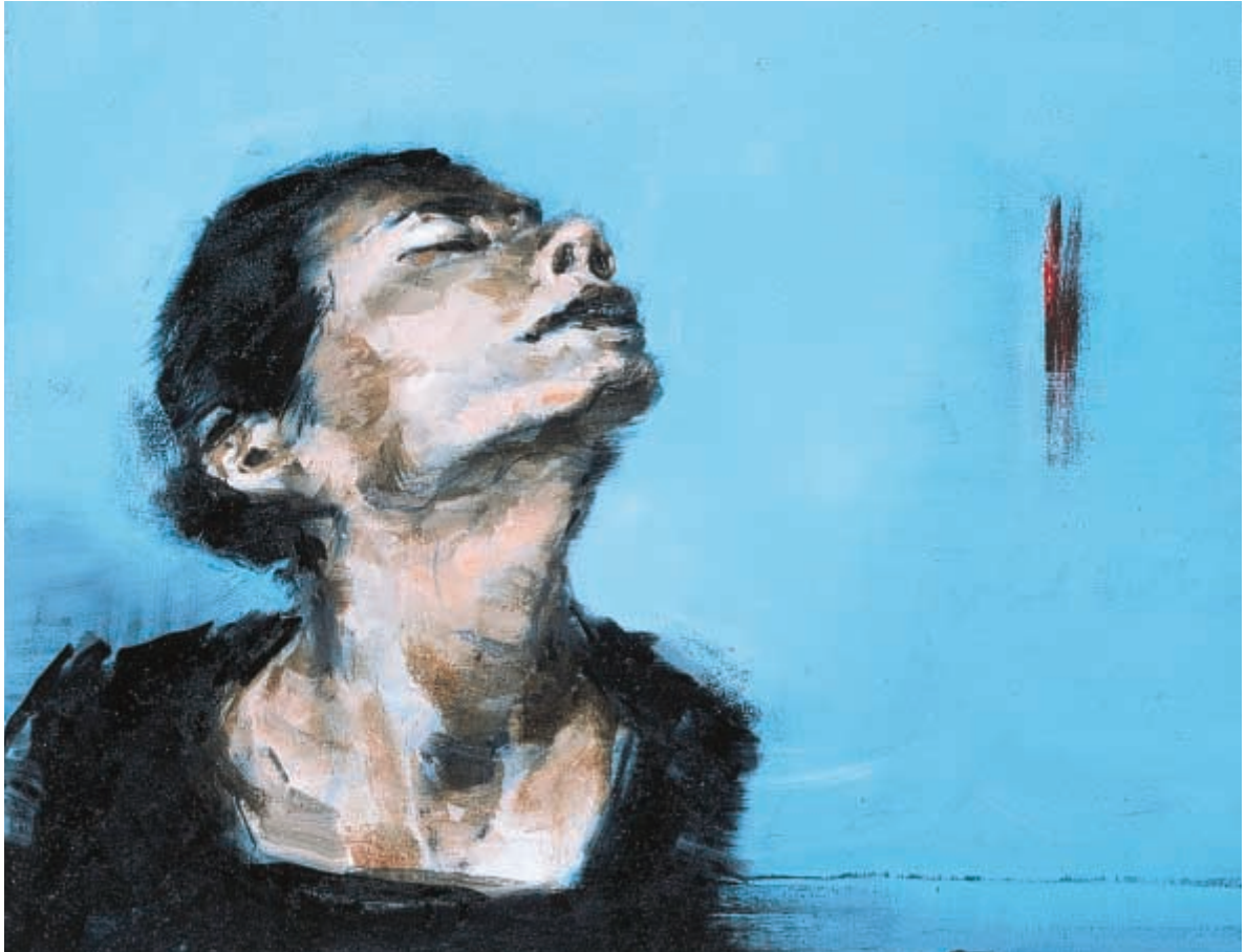
Pièce d'automne - huile sur toile - 40 x 50 cm - 2003