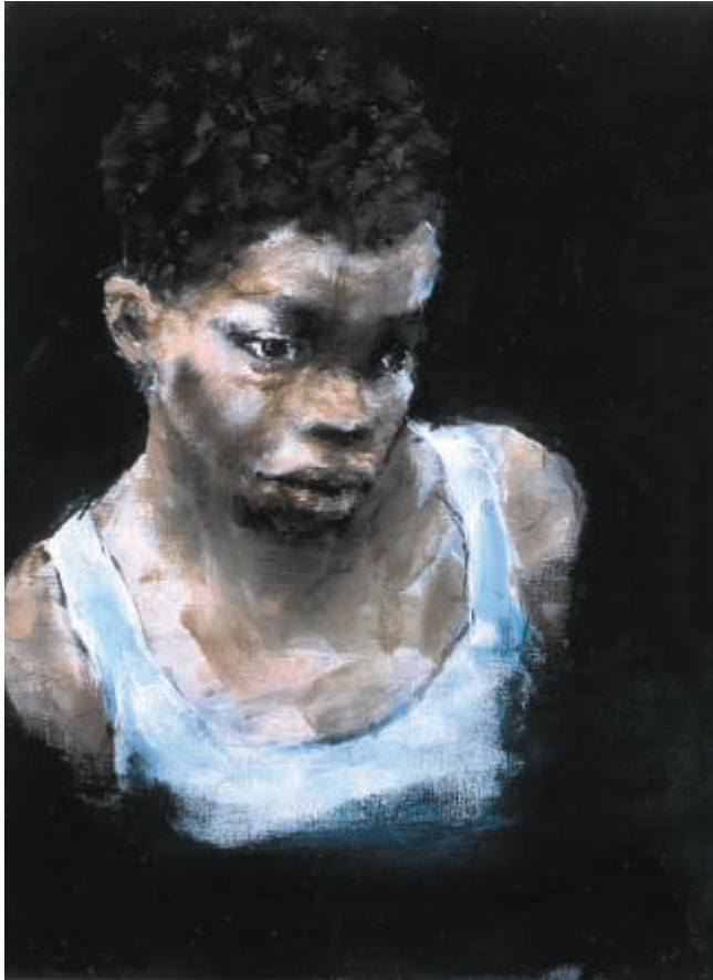
Fond de nuit - huile sur lin - 60 x 45 cm - 2003