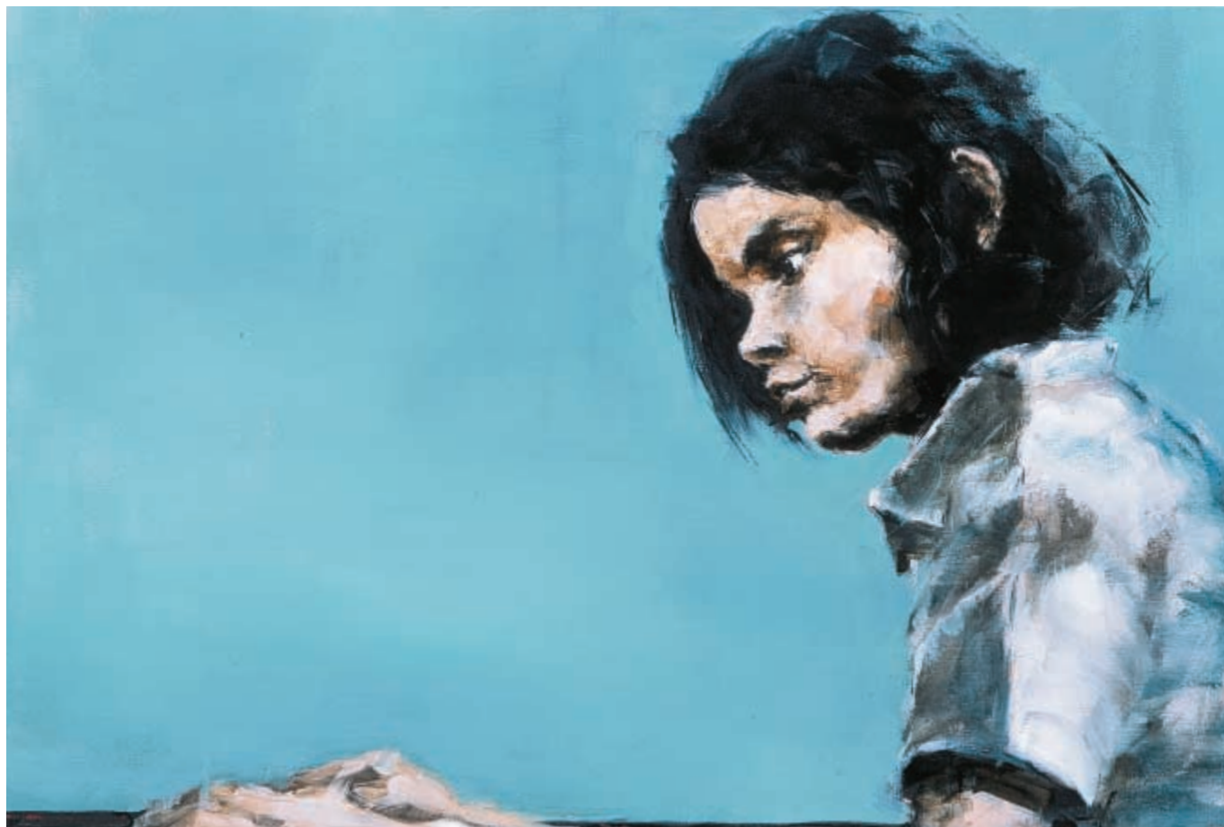
La pianiste sans piano II - huile sur toile - 60 x 89 cm - 2003