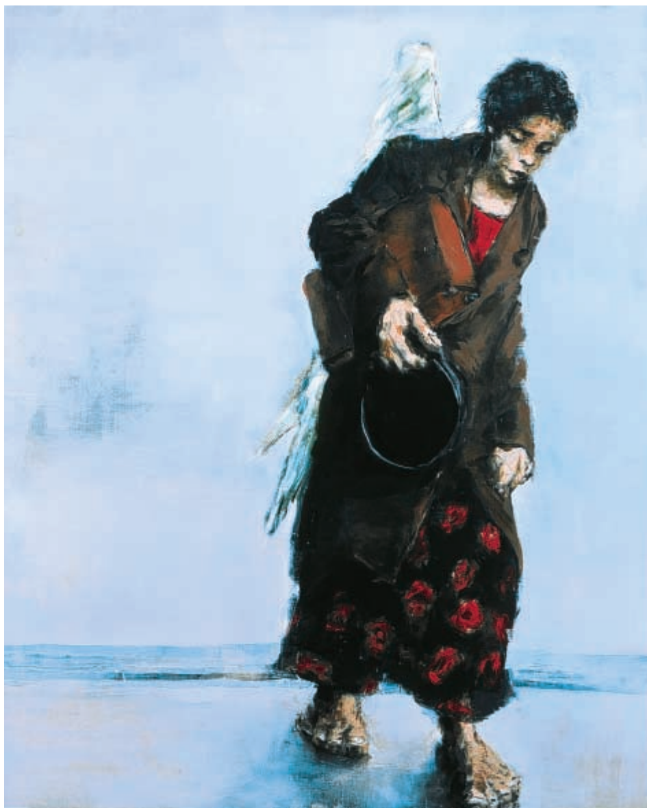
Latcho drom - huile sur toile - 120 x 96 cm - 2003