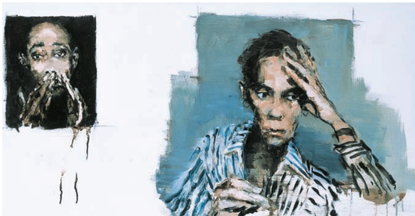
Deux pages - huile sur toile - 55 x 110 cm - 2001