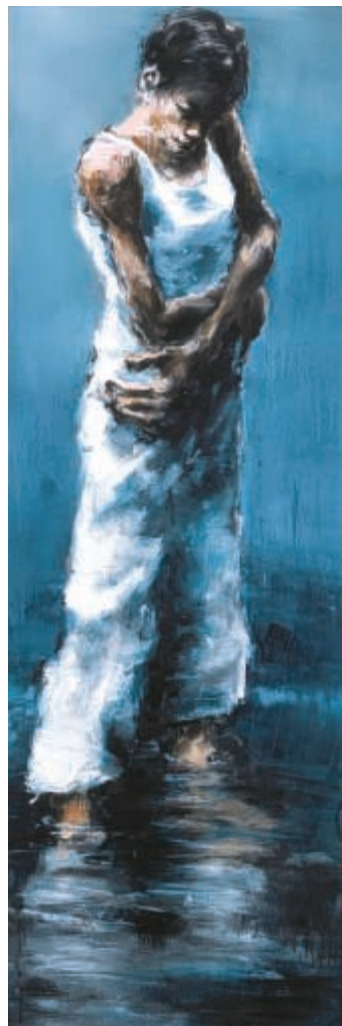
Water II - huile sur toile - 150 x 50 cm - 2003