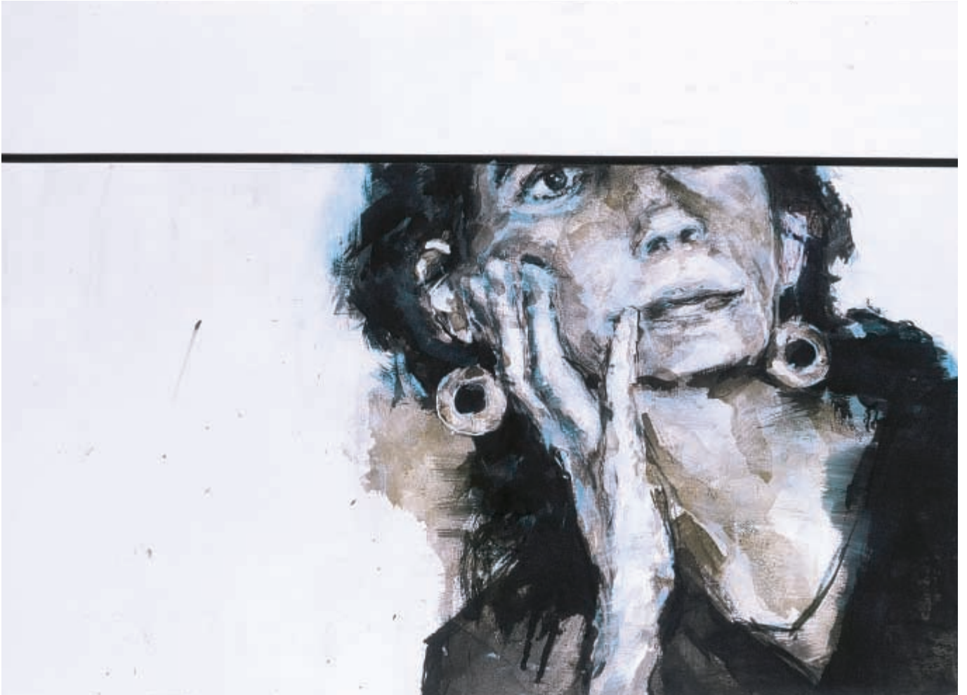
La chanteuse sans voix - mixte sur papier - 49 x 68 cm - 2001