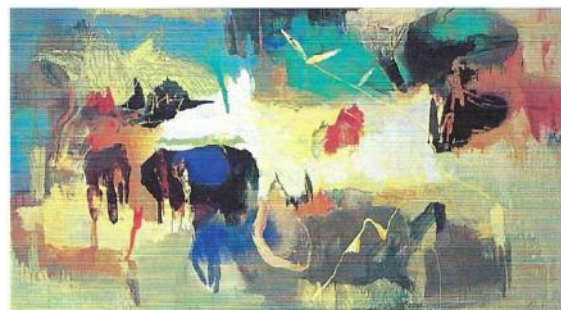
GONTARD "A L'OMBRE DU MINOTAURE" 2002, ACRYLIQUE S/TTOILE, 110x200 (GALERIE PRIVÉE)

(Inauguration le jeudi 6 juin à partir de 18h, les vendredi 7 et samedi 8 juin, de 11 à 13h et de 14 à 19h, le dimanche 9 juin, de 14 à 19h, dans les Rue des Beaux-Arts, Bonaparte, Jacques Callot, de l'Echaudé, Guénégaud, Jacob, Mazarine, Saint-Benoît, de Seine, Visconti, Quai Malaquais, Quai des Grands Augustins. Les spécialités représentées sont l'art moderne et contemporain, les arts décoratifs, design, antiquités, curiosités, les arts premiers, Extrême-Orient, archéologie, livres, gravures, photographies. Renseignements au 01 42 60 70 10 - Sélection d'œuvres sur www.art-saintgermaindespres.com ).