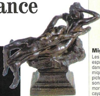
Rodin : « Fugit amor » 1881

La Première Guerre mondiale altérant la vie artistique parisienne, c'est à Barcelone que certains de ses membres les plus éminents vont poursuivre leur aventure. Exilés, Charchoune, Cravan, Robert et Sonia Delaunay, Picabia, Marie Laurencin, tissent des liens de complicité autour des formes nouvelles qui vont faire le